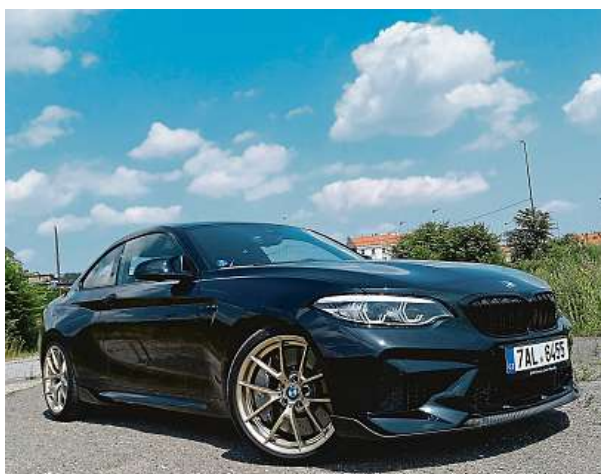
Autu vévodily zlatě lakované disky kol.