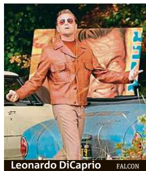
Leonardo DiCaprio FALCON

„Svým způsobem se tu ohlížíme za tím, co jeho tvorbu ovlivnilo, a na filmy, které se mu líbily, na období, v němž