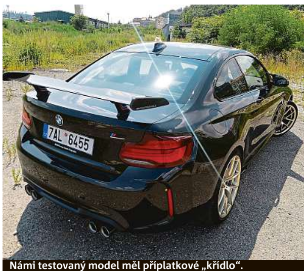
Námi testovaný model měl příplatkové „křídlo“.