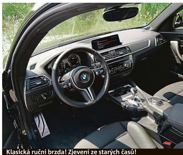
Klasická ruční brzda! Zjevení ze starých časů!