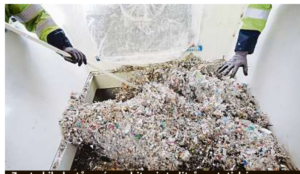
Ze sto kil plastů umí vyrobit asi sto litrů syntetické ropy.

V průběhu recyklace je využíváno takzvané tepelné krakování (štěpení), k němuž dochází při teplotách nad 300 °C. Jedná se o dobře známou metodu rafinace, při které se dlouhé a střední uhlovodíkové řetězce štěpí na jednodušší uhlovodíky. To znamená, že tento příklad aplikace cirkulární ekonomiky zároveň kompletně využívá stávající technologie. Surová ropa, jež je směsí uhlovodíků s relativně krátkými uhlovodíkovými řetězci, je proměňována na plasty s delšími uhlovodíkovými řetězci. Ty jsou pak metodou ReOil přeměněny zpět na směs jednodušších uhlovodíků. Technologii má OMV patentovanou.