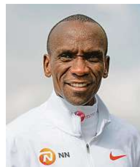
Eliud Kipchoge 2x PROFIMEDIA.CZ