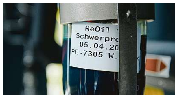
Využíváno je takzvané tepelné štěpení.