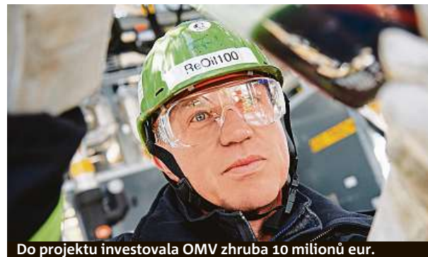
Do projektu investovala OMV zhruba 10 milionů eur.