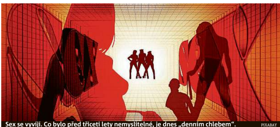
Sex se vyvíjí. Co bylo před třiceti lety nemyslitelné, je dnes „denním chlebem“.

Čím dál více lidí zanechává monogamních vztahů a oddává se takzvané polyamorii, tedy vztahu s více partnery. Tyto vztahy jsou ve společnosti stále přijatelnější a mnoho osob, i z řad celebrit, se o nich nebojí otevřeně promluvit. Pokud je polyamorie ve vztahu oboustranně přijatá a partner se neuchyluje ke lži, není na ní v podstatě nic zlého. Je však potřeba vždy dbát na ochranu, a to nejen před nechtěným otěhotněním, ale hlavně proti pohlavním chorobám, které se v milostných víceúhelnících mohou velmi snadno a rychle šířit.