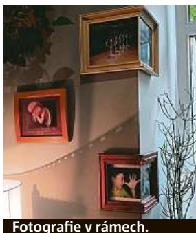
Fotografie v rámech.

Dvaosmdesátiletý čtenář deníku Metro Zdeněk Šimon není žádný profesionální umělec. Před nástupem do penze však pracoval ve stavebnictví a kutilská kreativní nátura mu zůstala dodnes. Jeho potřebu dělit se o své umělecké výtvořky, které začal ve