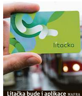
Lítačka bude i aplikace MAFRA

K prokázání nároku na slevu bude postačovat prokázat věk, ke slevě pro studenty od 18 do 26 let bude nutné se prokázat průkazem ISIC, žákovským průkazem nebo průkazem PID s potvrzením o studiu. Tyto slevy nahrazují žákovské jízdné v příměstské dopravě. Pro cestování po Praze se posouvá věková hranice mezi kategoriemi Junior a Student z 19 na 18 let. „To znamená nutnost doložit potvrzení o studiu i pro osmnáctileté, pokud chtějí cestovat levněji,“ doplňuje PID. FILIP JAROŠE VSKÝ