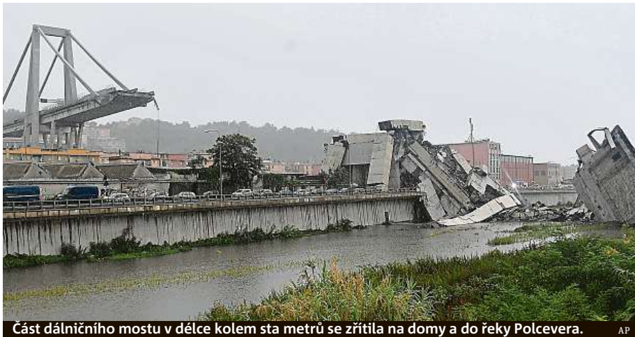
Část dálničního mostu v délce kolem sta metrů se zřítila na domy a do řeky Polcevera.