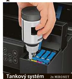
Tankový systém 2x MIRONET

Kompletní seznam tiskáren zařazených do akce cashback naleznete na stránkách www.mironet.cz/epson , kde si je také rovnou můžete koupit. Pokud tedy již nechcete nadále zbytečně platit za tisk více, než musíte, neváhejte a pořiďte si novou úspornou tankovou tiskárnu Epson ještě dnes.