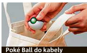
Poké Ball do kabely

Pokud i vás zasáhlo pokémonové šílenství, které po vydání hry Pokemon Go uchvátilo před dvěma lety doslova celý svět a noví hráči přibývali extrémní rychlostí, patrně vás potěší čerstvě oznámené novinky Pokémon Let's Go pro