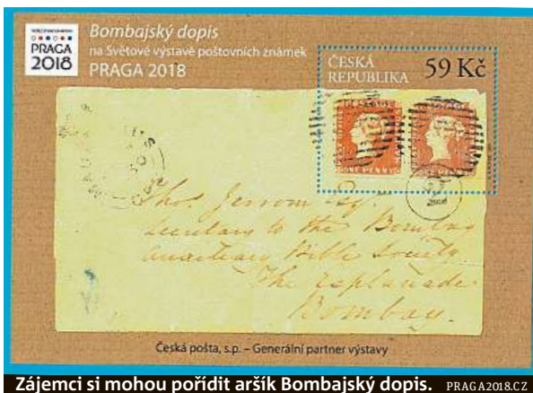
Zájemci si mohou pořídit aršík Bombajský dopis. PRAGA2018.CZ