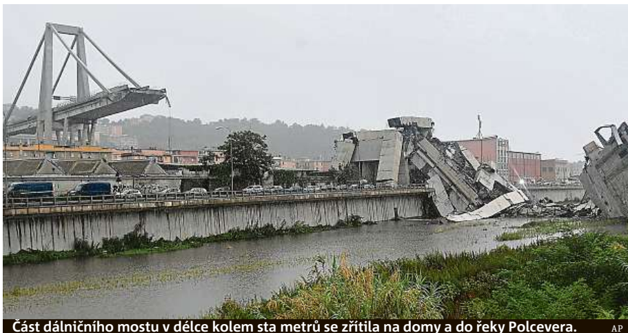
Část dálničního mostu v délce kolem sta metrů se zřítila na domy a do řeky Polcevera.

Deset minut před včerejším polednem se v italském přístavu Janově zřítila velká část mostu Ponte Morandi na dálnici A10. Jeho vozovka byla v pětáctiřícetmetrové výšce nad městskými ulicemi. Podle záchranářů spadla zhruba desítky aut, včetně nákladních. Ředitel záchranné služby Francesco Bermano řekl agentuře Adnkronos, že neštěstí způsobilo smrt minimálně dvou desítek lidí. V sutinách je podle záběrů rozdrčených několik vozidel. Z mostu podle České televize spadl i kamion pražské dopravní společnosti SPED-IT. Řidič nebezpečnou nehodu přežil.