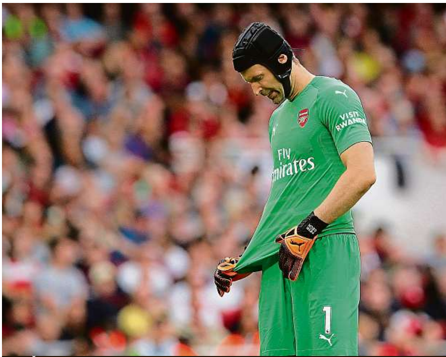
Petr Čech během utkání anglické ligy s Manchesterem City

Český gólman v reakci vyčetl Leverkusenu nedostatečnou profesionalitu. Z německé strany se mu poté dostalo omluvy. Situaci, kdy si Čech při snaze o rychlou rozehrávku málem dal vlastní gól, hojně sdíleli fanoušci na sociálních sítích. Na jedno z těchto videí zareagoval Bayer postem: „My bychom o někom věděli...“ a připojil video s ro-