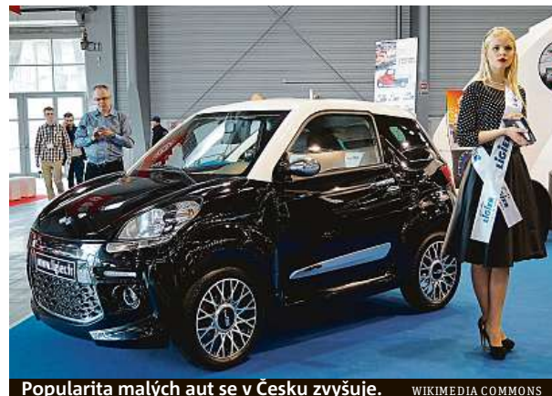
Popularita malých aut se v Česku zvyšuje.

Řidičák tento dopravní prostředek ale musí zájemci dělat na skútru. „Zákon však umožňuje absolvovat čtyři cvičné jízdy ze třinácti na mo-