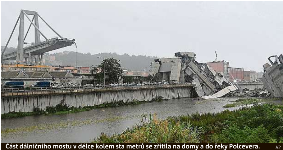
Část dálničního mostu v délce kolem sta metrů se zřítila na domy a do řeky Polcevera.

Deset minut před včerejším polednem se v italském přístavu Janově zřítila velká část mostu Ponte Morandi na dálnici A10. Jeho vozovka byla v pětáctiřícetimetrové výšce nad městskými ulicemi. Podle záchranářů spadla zhruba desítky aut, včetně nákladních. Ředitel záchranné služby Francesco Bermano řekl agentuře Adnkronos, že neštěstí způsobilo smrt minimálně dvou desítek lidí. V sutinách je podle záběrů rozdrčených několik vozidel. Z mostu podle České televize spadl i kamion pražské dopravní společnosti SPED-IT. Řidič nebezpečnou nehodu přežil.