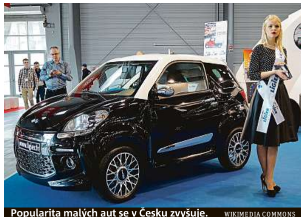
Popularita malých aut se v Česku zvyšuje.

Řidičák tento dopravní prostředek ale musí zájemci dělat na skútru. „Zákon však umožňuje absolvovat čtyři cvičné jízdy ze třinácti na mo-