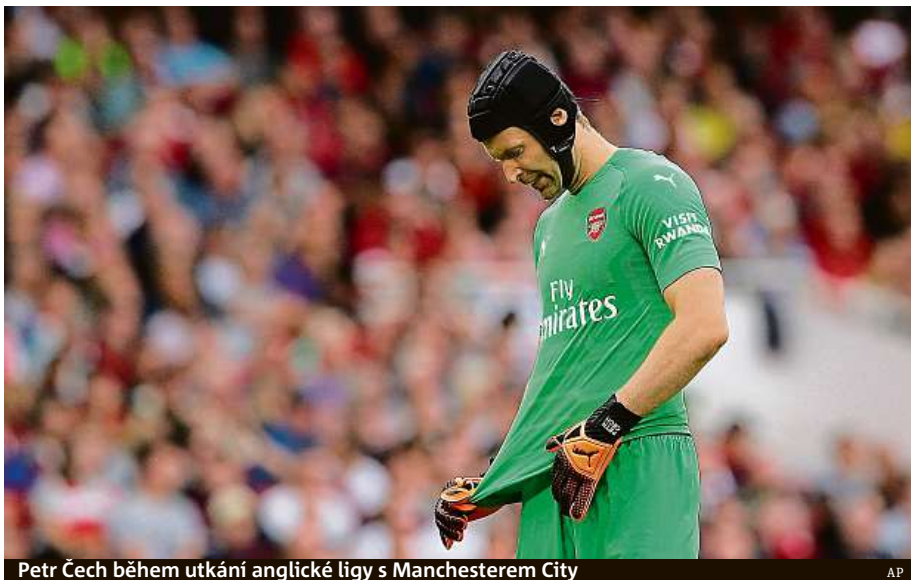
Petr Čech během utkání anglické ligy s Manchesterem City

Český gólman v reakci vyčetl Leverkusenu nedostatečnou profesionalitu. Z německé strany se mu poté dostalo omluvy s vysvětlením, že šlo jen o žert. Situaci, kdy si Čech při snaze o rychlou rozehrávku málem dal vlastní gól, hojně sdíleli fanoušci na sociálních sítích. Na jedno z těchto videí zareagoval Bayer postem: „My bychom