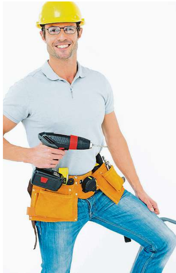
Půjčovny nabízejí i drobné nářadí.

V Česku se ale rozbíhá i model sdíleného nářadí. Internetová služba SharyGo za úplatu zprostředkovává půjčování sportovního vybavení či nářadí mezi lidmi. Start-up podle Hospodářských novin expanduje do regionů a rozjíždí spolupráci s kamennými půjčovnami. Podle šéfa firmy Dana Erlebacha může být pro lidi výhodnější si sezonní sportovní vybavení jako lyže raději za pár stokorun půjčit než platit vyšší částky za jejich pořízení. MET