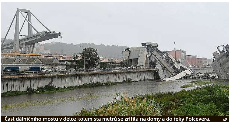
Část dálničního mostu v délce kolem sta metrů se zřítila na domy a do řeky Polcevera.

Deset minut před včerejším polednem se v italském přístavu Janově zřítila velká část mostu Ponte Morandi na dálnici A10. Jeho vozovka byla v pětáctiřícetmetrové výšce nad městskými ulicemi. Podle záchranářů spadla zhruba desítky aut, včetně nákladních. Ředitel záchranné služby Francesco Bermano řekl agentuře Adnkronos, že neštěstí způsobilo smrt minimálně dvou desítek lidí. V sutinách je podle záběrů rozdrčených několik vozidel. Z mostu podle České televize spadl i kamion pražské dopravní společnosti SPED-IT. Řidič nebezpečnou nehodu přežil.