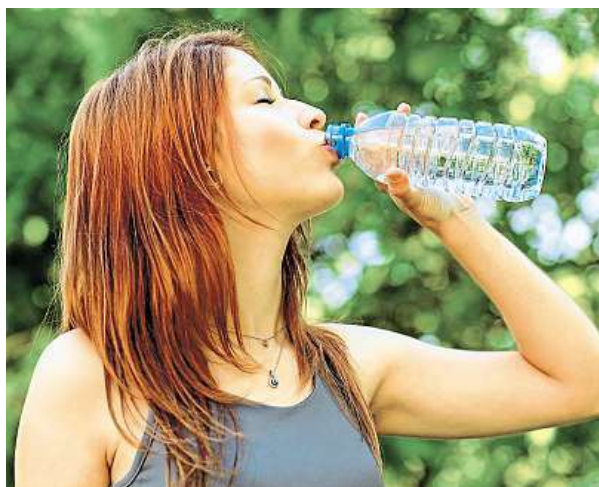
Pijte pravidelně a dostatečně.

Na to, zda pijete málo, nebo dostatečně, vás upozorní barva moči: správně by měla být světle žlutá. Pokud je tmavší, znamená to, že organismus není dostatečně zásoben tekutinami.