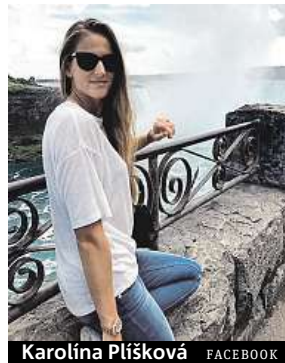
Karolina Plíšková

Světová tenisová jednička obhájuje v Cincinnati triumf.