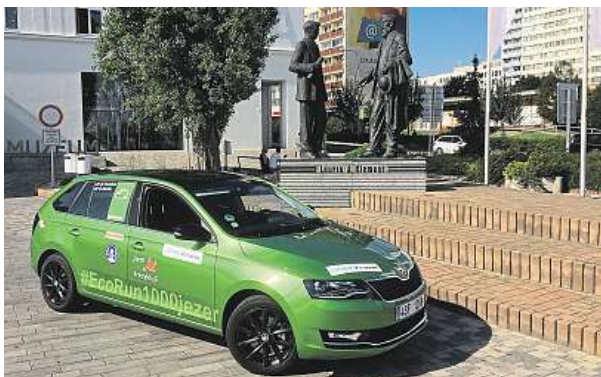
Expediční škodovka na startu v Mladé Boleslavi