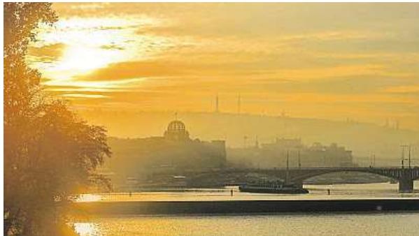
Praha je krásná v jakoukoliv denní dobu.

Využívám průřez a také kontrasty nového a starého. Orientuji se hodně podle světla, takže se řídím tím, kdy na