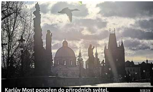
Karlův Most ponořen do přírodních světél.