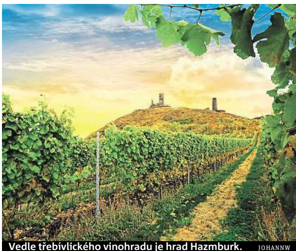
Vedle třebívlického vinohradu je hrad Hazmburk.