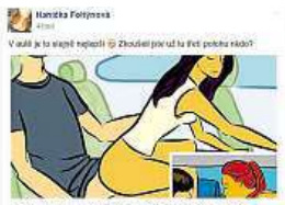
Ukázka chytáku FACEBOOK

Mnohem horší je to ale s těmi stránkami, které obsahují viry. „S podobným systémem sdílení stránek se setkáváme často. Posledním případem bylo sdílení smyšlených zpráv o vraždě prezidenta Miloše Zemana,“ uvedl Petr Šnajdr, bezpečnostní expert společnosti Eset. Podle něj je cílem těchto odkazů vylákání uživatelů na stránky se škodlivým obsahem. „Casto jsou