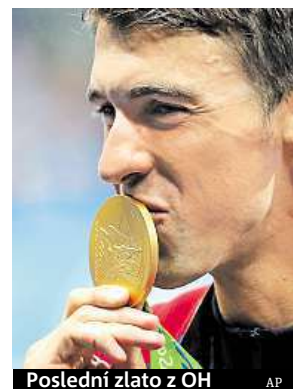
Poslední zlato z OH

Americký plavec Michael Phelps získal díky triumfu v polohové štafetě na 4x100 metrů v Rio páté zlato.