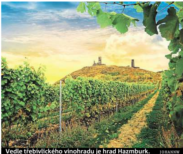
Vedle třebívlického vinohradu je hrad Hazmburk.