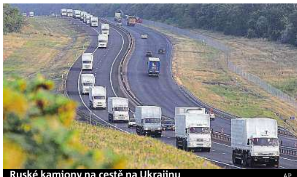
Ruské kamiony na cestě na Ukrajinu

Konvoj, který vypravila ruská vláda v noci na úterý, čítá takřka 300 vozidel. Původně se předpokládalo, že kolona přijede do Charkovské oblasti na Ukrajině. Tento plán je však již minulostí, vozidla včera stála před Luhanskem,