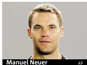
Manuel Neuer

54 novinářů z členských zemí UEFA. Ti budou vítěze při slavnostním ceremoniálu vybírat živě pomocí elektronického systému. ČTK