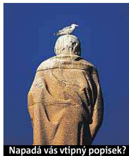
Napadá vás vtipný popisec?

Napište bublinu a reagujte na sloupek na: www.facebook.com/denikmetro