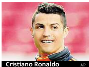
Cristiano Ronaldo