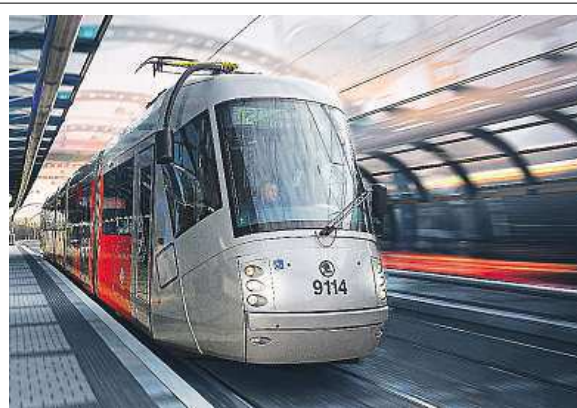
Co všechno bolí tramvaje 14T?

Dopravní podnik místo nich nasadil modernější 15T ForCity. „Dočasné přerušení provozu tramvají se cestujícími nijak nedotklo, odstavné vozy jiných typů z vozového parku. Dopravní podnik je současně připraven na zajištění