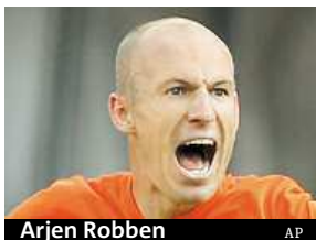
Arjen Robben