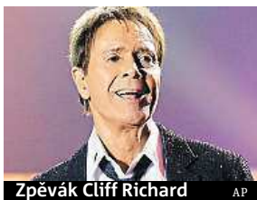
Zpěvák Cliff Richard

Policie včera v souvislosti s vyšetřováním údajného sexuálního zneužití chlapce mladšího 16 let prohledala bydlíště britského zpěváka Cliffa Richarda v Berkshiru. Vyšetřování se týká případu z 80. let. Zpěvák však policie nezastihla, je v zahraničí. ČTK