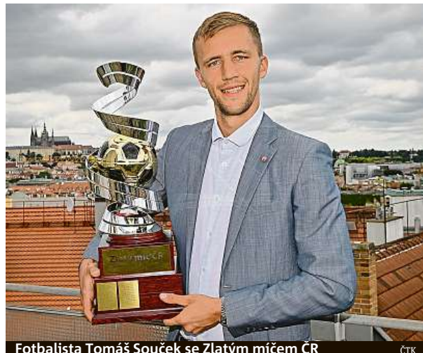
Fotbalista Tomáš Souček se Zlatým míčem ČR

Teprve potřetí za posledních dvanáct sezon nevyhrál Zlatý míč brankář. Souček dokázal obhájit vítězství jako