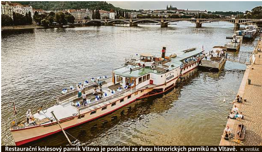
Restaurační kolesový parník Vltava je poslední ze dvou historických parníků na Vltavě.

Nás ale zajímá parník Vltava, loď vyrobená v roce 1940 v libeňském přístavu. Mimochodem loni se do něj plavidlo v rámci výročí zajelo podí-