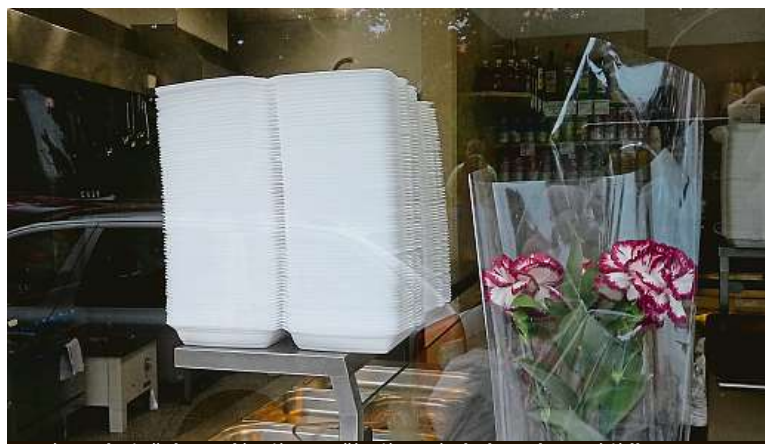
Zatím se hojně doprodávají a používají staré obaly na hotová jídla. METRO

materiálů. „Máme třeba průhledné vaničky z recyklovatelného plastu, ten vydrží dokonce i teplý pokrm, nezkroutí se,“ říká vedoucí smíchovské Korunky. Jestli ho lze recyklovat bez umytí od jídla, to netuší. PAVEL HRABICA