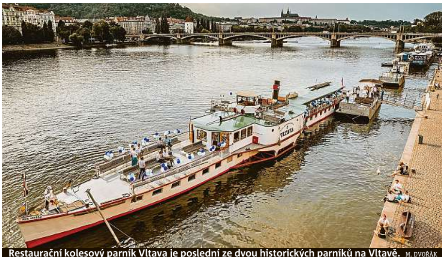
Restaurační kolesový parník Vltava je poslední ze dvou historických parníků na Vltavě. M. DVOŘÁK

Nás ale zajímá parník Vltava, loď vyrobená v roce 1940 v libeňském přístavu. Mimochodem loni se do něj plavidlo v rámci výročí zajelo podí-