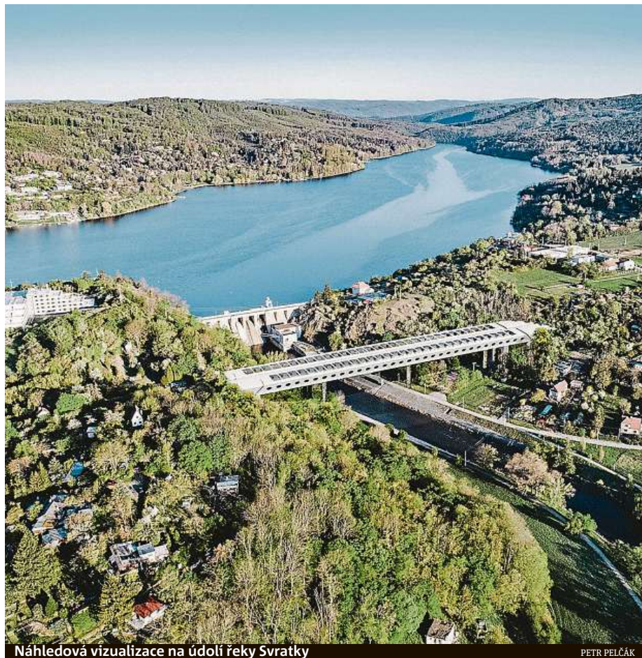
Náhledová vizualizace na údolí řeky Svatky