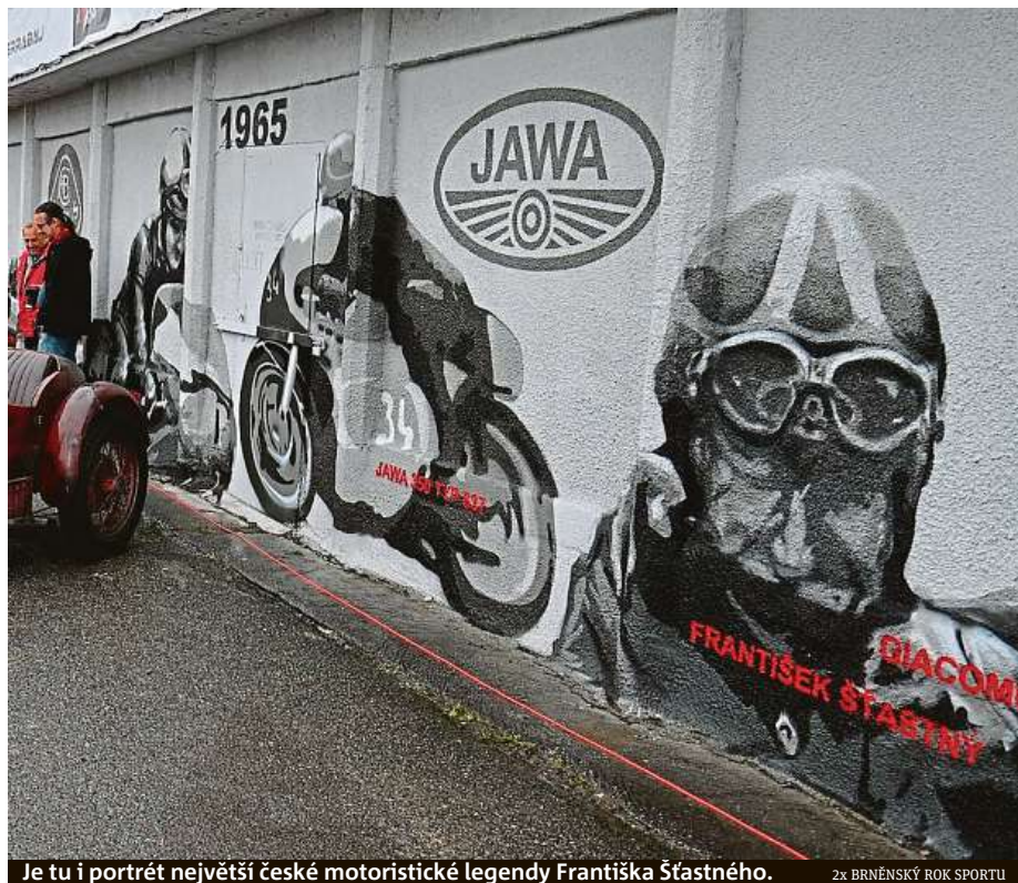
Je tu i portrét největší české motoristické legendy Františka Šťastného.