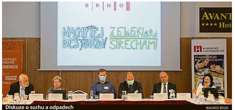
Diskuze o suchu a odpadech

Čeští poslanci ve Sněmovně projednávají novou odpadovou legislativu. „Námi předložený zákon o odpadech obsahuje nástroje k tomu, aby se s odpady nakládalo jako se zdroji a abychom je neposílali bezúčelně na skládky. V současné době skládkujeme zhruba 46 procent z celkové produkce komunálních odpadů. To je