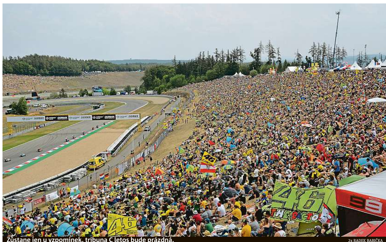
Zůstane jen v vzpomínkách, tribuna C letos bude prázdná.