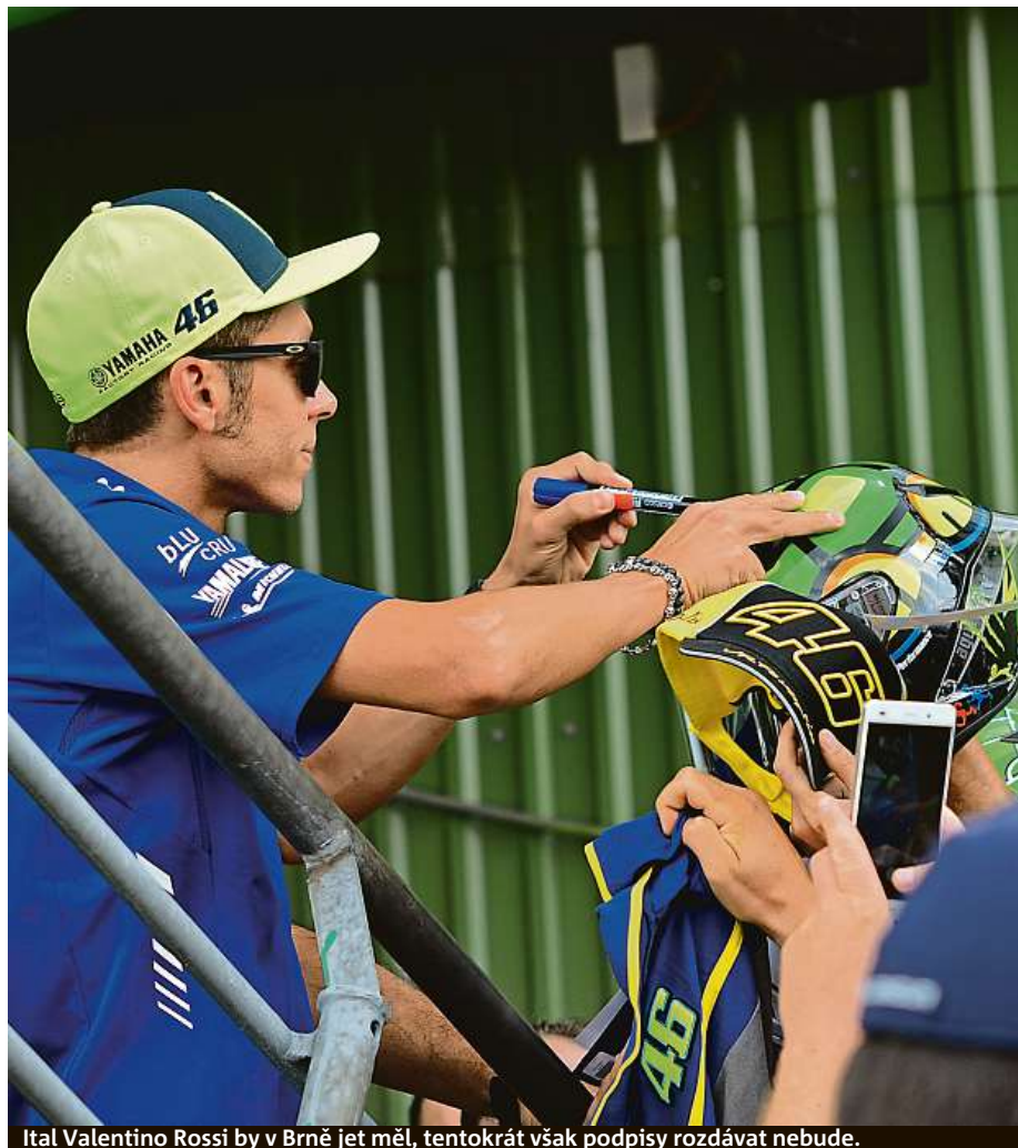
Ital Valentino Rossi by v Brně jet měl, tentokrát však podpisy rozdávat nebude.