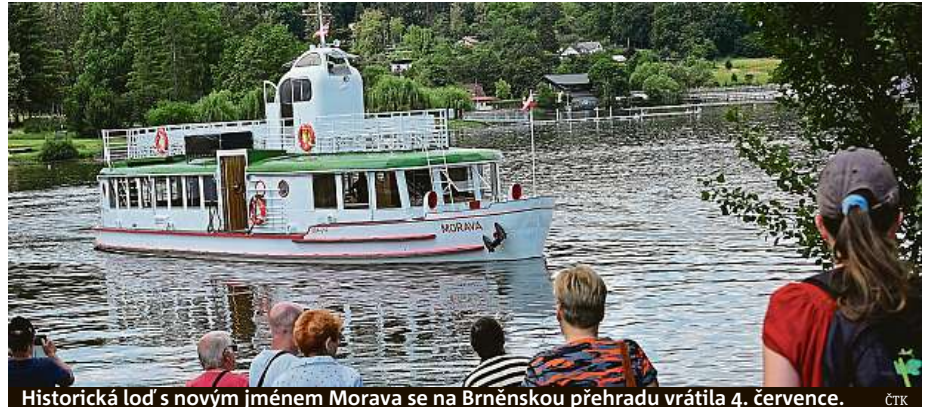
Historická loď s novým jménem Morava se na Brněnskou přehradu vrací 4. července.

Rekonstrukce stála 15 milionů korun. Deset milionů platilo město, pět milionů pokryla dotace z ministerstva pro místní rozvoj. „Nyní se loď mohla vrátit na přehra-