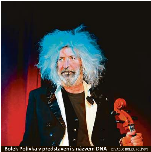
Bolek Polívka v představení s názvem DNA DIVADLO BOLKA POLÍVKY

V pondělí převezme otěže na Biskupském dvoře Divadlo Bolka Polívky. Během třinácti dnů zde pod širým nebem uvede hry ze svého repertoáru i inscenace spřízněných divadel. Samotný princip divadla Bolek Polívka se zde představí v DNA, hře vy-