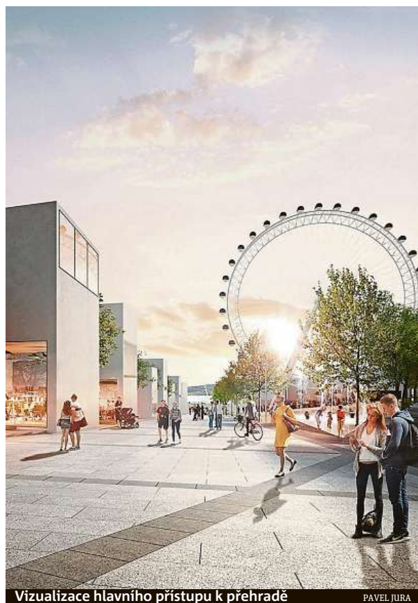
Vizualizace hlavního přístupu k přehradě