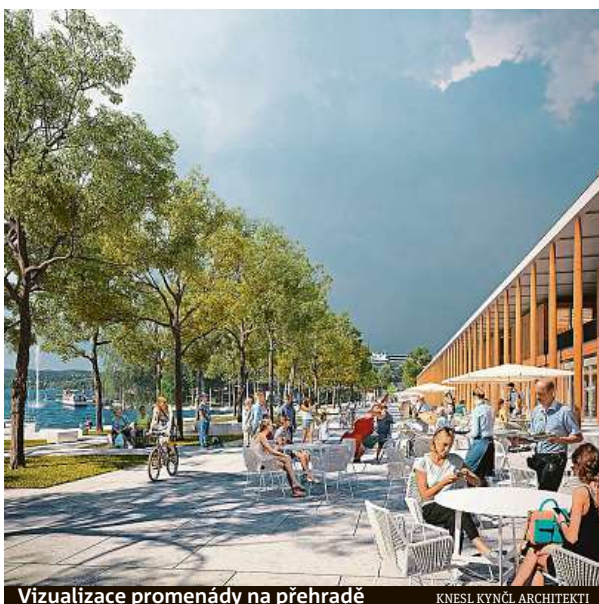
Vizualizace promenády na přehradě