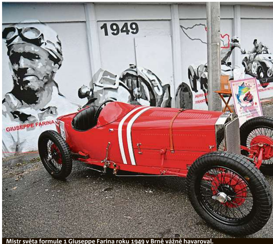
Mistr světa formule 1 Giuseppe Farina roku 1949 v Brně vážně havaroval.