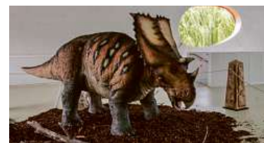
Hned vstupu vás přivítá pohyblivý dinosaurus.

Období, kdy žili dinosauři, vám přiblíží i prázdninový program s pokusy Cesta do druhohor . Zažijete tu výbuch sopky nebo si vyzkoušíte hledání pravěkých fosilií. Také zjistíte, jak vypadá trilobit nebo