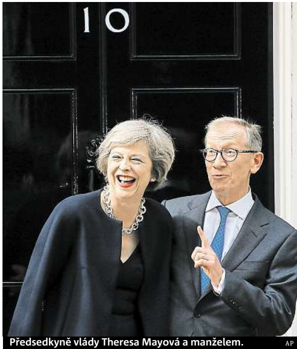
Předsedkyně vlády Theresa Mayová a manželem.

Složení britské vlády ostře kritizoval také šéf Evropského parlamentu Martin Schulz. Podle něj je sestavována hlavně v zájmu udržení jednoty Konzervativní strany. Post ministryně životního prostředí v ní získala i Mayové konkurentka v boji o premiérské křeslo Andrea Leadsomová. ČTK, METRO