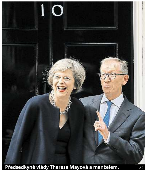
Předsedkyně vlády Theresa Mayová a manželem.

Složení britské vlády ostře kritizoval také šéf Evropského parlamentu Martin Schulz. Podle něj je sestavována hlavně v zájmu udržení jednoty Konzervativní strany. Post ministryně životního prostředí v ní získala i Mayové konkurentka v boji o premiérské křeslo Andrea Leadsomová. ČTK, METRO