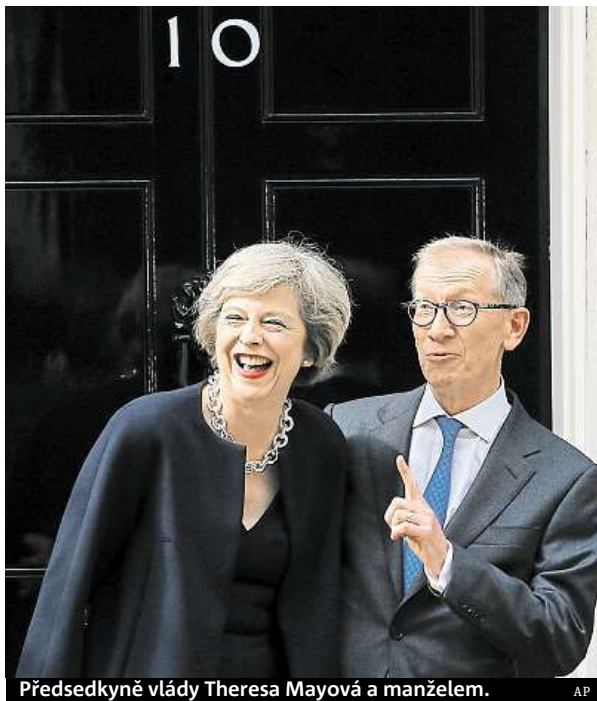
Předsedkyně vlády Theresa Mayová a manželem.

Složení britské vlády ostře kritizoval také šéf Evropského parlamentu Martin Schulz. Podle něj je sestavována hlavně v zájmu udržení jednoty Konzervativní strany. Post ministryně životního prostředí v ní získala i Mayové konkurentka v boji o premiérské křeslo Andrea Leadsomová.