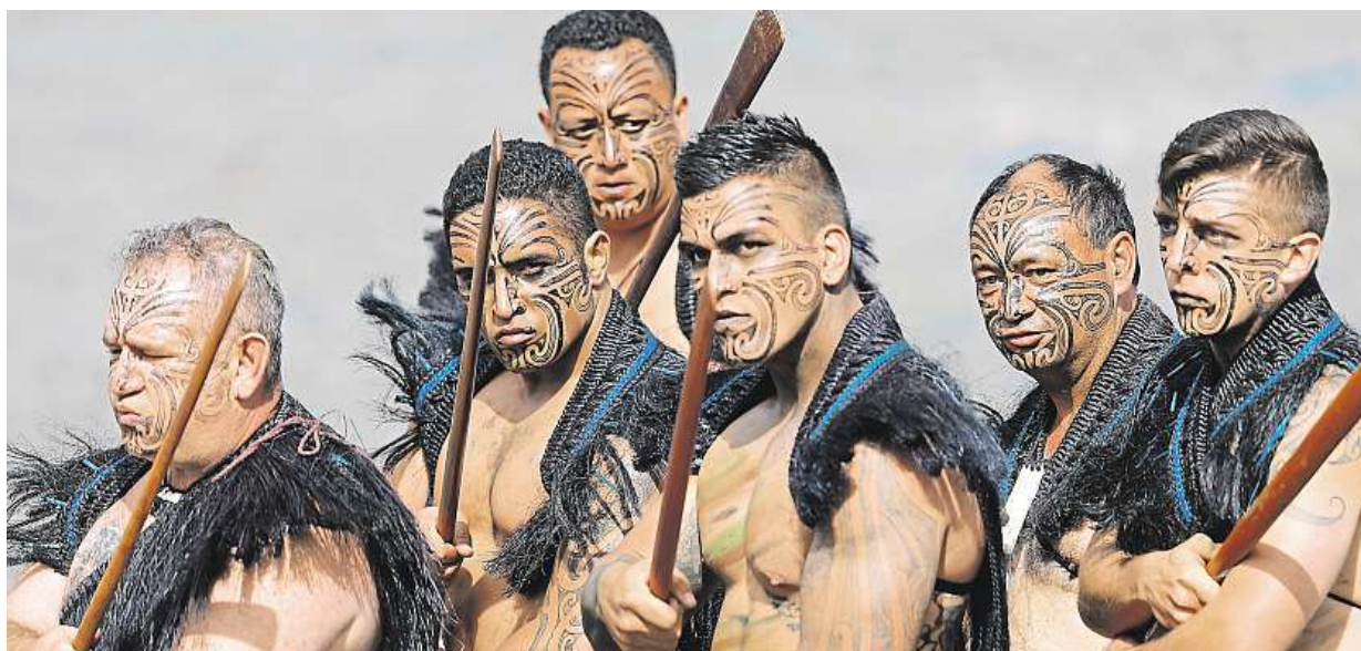
Cestními hosty vojenské přehlídky u příležitosti výročí pádu Bastily byli také Maorové. Ti po pařížské dlažbě kráčeli bosí.

Korál od moře. Turisté si často domů berou kousek přírody z dovolené. Pokuta. Při kontrole na hranicích ale mohou mít problémy. Seznam. Co je dovolené a co ne, na to vás upozorní také cestovní kanceláře STRANA 3