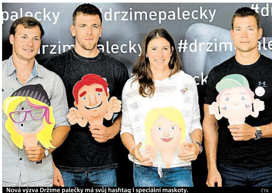
Nová výzva Držíme palečky má svůj hashtag i speciální maskoty.