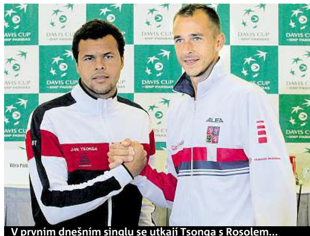
V prvním dnešním singlu se utkájí Tsonga s Rosolem...

kem a oba v sobotu i nastoupí. Proti nim se postaví nejlepší deblisté současnosti a vítězové Wimbledonu Nicolas Mahut, Pierre-Hugues Herbert. Do Trince přijel i Gilles Simon, ale kapitán Francie Yannick Noah ho do sestavy dodatečně nezařadil. ČTK