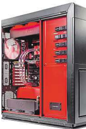
Počítač podle vás