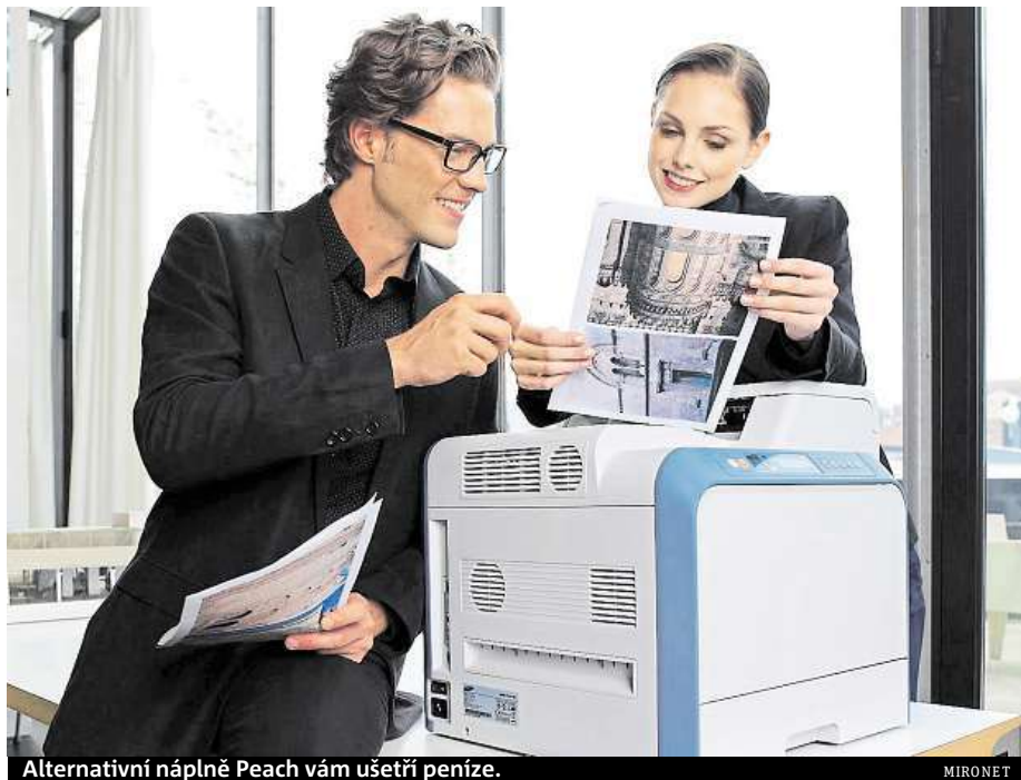
Alternativní náplně Peach vám ušetří peníze.

U většiny produktů se navíc při nákupu právě v Mironetu můžete těšit na praktický dáreček v podobě voňavého stromečku airfresh. Budte chytří a neplatte za kvalitní tisk a kancelářské potřeby více než musíte.