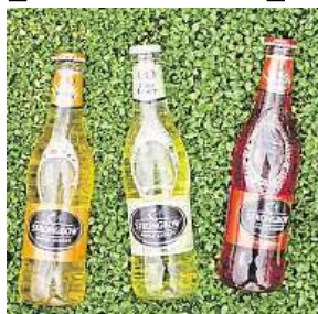
Cider Strongbow HEINEKEN

Jemně perlivým ciderům Strongbow propadly miliony lidí po celém světě a po loňském vstupu na náš trh si podmanily i chuťové buňky českých mužů a žen. Celosvětově nejprodávanější cider láká na jemně sladkou jableč-