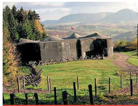
VOJENSKÁ PEVNOST STACHELBERG

• Nedaleko hranic s Německem, deset kilometrů od Trutnova směrem na Žacléř, je vojenská pevnost z druhé světové války Stachelberg, která nebyla nikdy dokončena, přesto je obdivuhodná. Byla rozestavěna v říjnu 1937 jako jedna z největších pevností svého typu na světě, její výstavbu však v říjnu 1938 ukončila mnichovská dohoda. To, co se za necelý rok podařilo vybudovat, tu leží dodnes a je zrekonstruováno a zpřístupněno. V areálu najdete nadzemní objekty i zákopy, ale největší zážitek vás čeká v podzemí. Unikátní systém je 3,5 kilometru dlouhý a nachází se v hloubce 25 až 60 metrů.