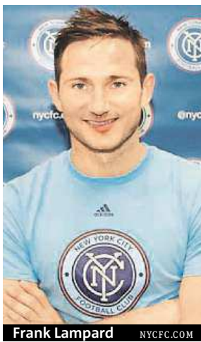
Frank Lampard NYCFC.COM

Především show pro diváky bude utkání hvězd zámořské fotbalové MLS proti anglickému Tottenhamu.