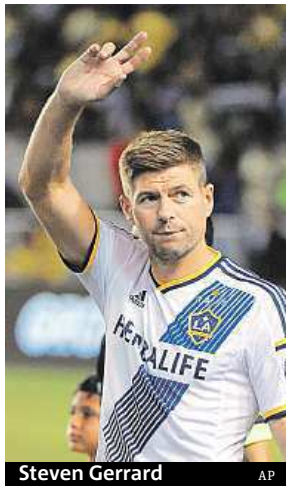
Steven Gerrard

Anglické legendy Steven Gerrard a Frank Lampard ještě za své nové kluby v Major League Soccer neodehráli ani minutu, ale už nechybí ve výběru ligových hvězd. Postaral se o to komisionář MLS Don Garber, který oba zkušené záložníky zařadil do týmu. All-Star Game proti Tottenhamu se odehraje 29. července.