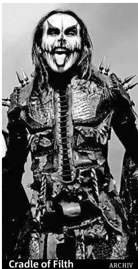
Cradle of Filth

„Letošní výročí jsme se rozhodli oslavit line-upem doslova nabušeným kapelami střední velikosti, bez důrazu na velkého headlineru, protože tento přístup umožní největšímu množství fanoušků vychutnat si co největší množství oblíbených kapel,“ říká za pořadatele festivalu Tomáš Karlík.