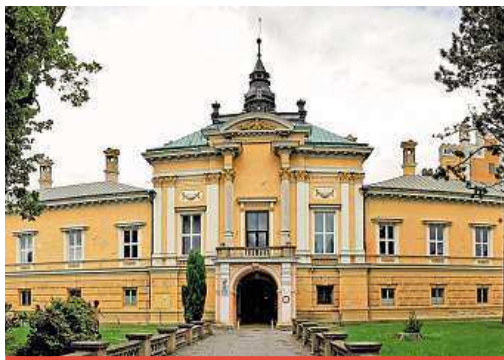
ZA HISTORIÍ NA ZÁMEK SVĚTLÁ

Aktivní dovolenou Češi milují. Nevydrží ležet týden v chatce. Přinášíme proto tři tipy, kam vyrazit.