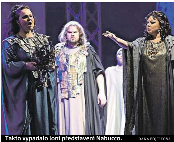
Takto vypadalo loni představení Nabucco.

Pradávný příběh z prostředí starověkého Egypta je jako stvořený pro letní večery. A právě genius loci, jemuž pomáhají skvostné zahrady na zámcích Sychrov a Lednice nebo venkovní dějiště letní kultury na Letenské pláni v Praze či ostravské Dolní oblasti Vítkovic, vtiskne každému z představení jedinečnou kulisu.