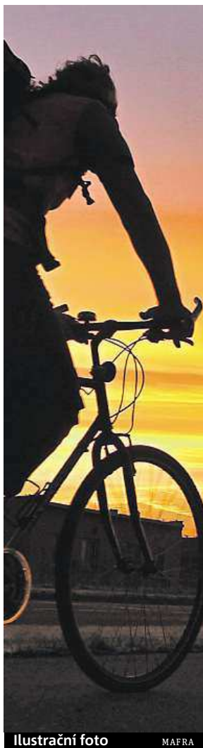
Ilustrační foto MAFRA