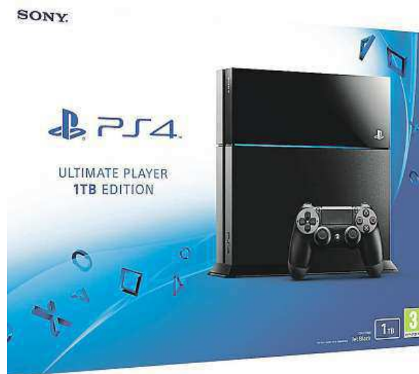
Milovníci PlayStationu rozhodně zpozorní.