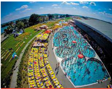
KOUPÁNÍ A HRÁTKY V AQUALANDU

• V Pasohlávkách u Brna vyrostl největší a nejmodernější akvapark v tuzemsku Aqualand Moravia. Je tu dvacet tobogánů a klouzaček, dvanáct bazénů o celkové vodní ploše tři tisíce metrů čtverečních, v některých je geotermální voda, jež posiluje imunitu. Najdete tu i místo pro relax s 24 saunami a nespočtem procedur. Letošní novinkou je pool bar, u kterého si můžete vychutnat pití přímo z bazénu Neptun. Okolo zastřešeného objektu je uzavřený pětihektarový areál, kde probíhají animační programy pro děti i dospělé nebo si tu můžete zahrát beachvolejbal.