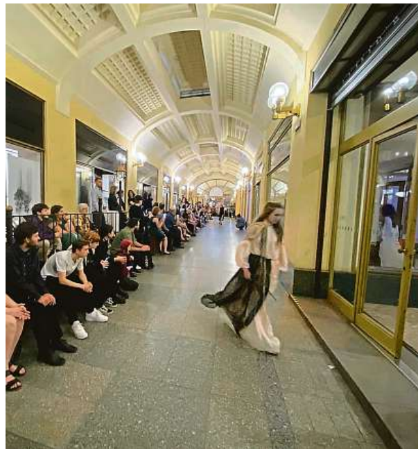
V pasáži domu U Nováků probíhá po celý rok řada akcí a výstav. Pocta španělskému malíři Picassovi již začala. 3KINO FEST

„Pasáž domu U Nováků oživí výstavy mladých talentovaných umělců z Česka, Slovenska a Polska,“ popisuje ředitel 3Kino Vavřinec Menšl. „V kontrastu i pro srovnání divákům také představujeme díla významných tvůrců ze soukromých sbírek, která nejsou běžně k vidění,“ doplňuje koncepci Vavřinec Menšl. ČTK