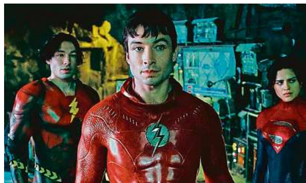
Ezra Miller a Sasha Calle (vpravo). Ta je již čtvrtou herečkou, která ztvárňuje v hrané podobě postavu Supergirl.

bude moci bez problému „vběhnout“ do kinosálů, objevila se další nemalá překážka. Představitel Flashe Miller měl totiž před několika měsíci hned několikrát opletačky se zákonem. Nešlo o žádné prkotiny. V souvislosti s ním se hovořilo o vyhrožování, svádění dětí či vloupání. Proč v recenzi rozebíráme soukromý život hlavní herecké hvězdy? Důvod je prostý. Člověka, který je fanouškům ze dne na den sympatický asi tak jako neštovice, by každé velké hollywoodské studio na místě vyrazilo a z filmu v rámci zklidnění rozčeřených vod vystříhlo.