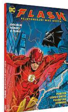
Flash: Nejrychlejší muž světa je prequelem nového filmu. CREW

Snímek Flash , který přichází dnes do kin, je ve skutečnosti třetí adaptací zmiňovaného DC komiksu Flashpoint . Po animovaném filmu Liga spravedlivých: Záchranáři světa (2013) a třetí sérii seriálu Flash (od roku 2014). JAR