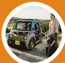
Citroën My Ami Buggy II