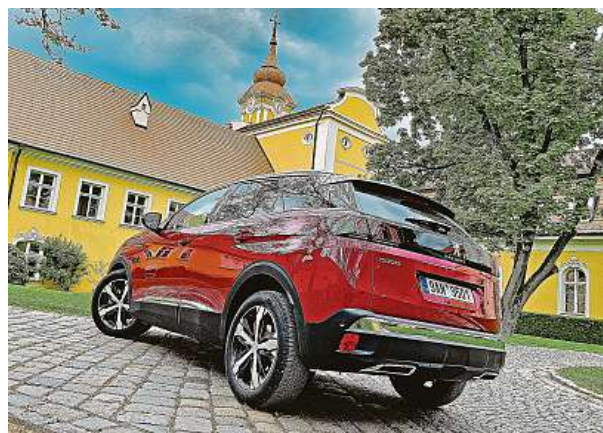
Zadní full LED lampy mají 3D grafickou evokovat lví drápy. Zejména v noci parádně vyniknou.