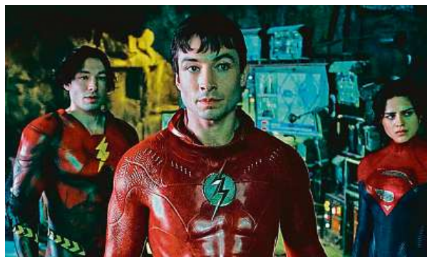
Ezra Miller a Sasha Calle (vpravo). Ta je již čtvrtou herečkou, která ztvárňuje v hrané podobě postavu Supergirl. 2x VERTICAL ENT.

Cesta superychlého kladěse na filmové plátno nebyla ani pod taktovkou úspěšného režiséra Andyho Muschiettiny (dosud natočil horory To, To 2 a Mama ) právě snadná. Po neúspěchu Ligy spravedlnosti (2017, režisérská verze 2021), kde se Flash objevil po boku Supermana či Wonder Woman , natáčení i datum premiéry několikrát odložili. Původně měl snímek dorazit do kin už před pěti lety. V cílové rovině, kdy to už už vypadalo, že snímek