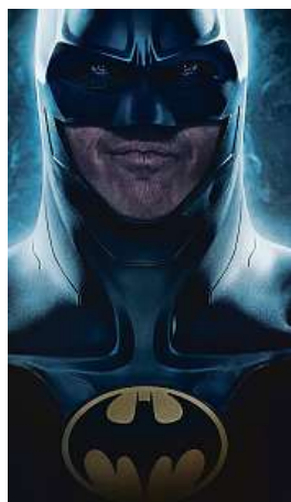
Michael Keaton si roli Batmana užil i po letech.