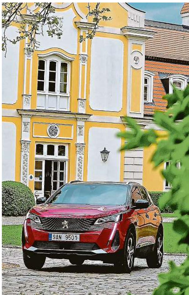
Automobilka Peugeot představila druhou generaci modelu 3008 již v roce 2016 – je to tedy už sedm let! A stále mu to sluší.