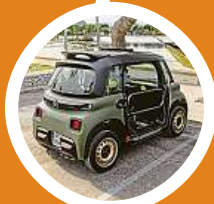
Nemá dveře ani střechu.