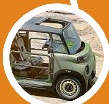
Vyrobena pouze 1000 kusů. Objednávky od 20. června.