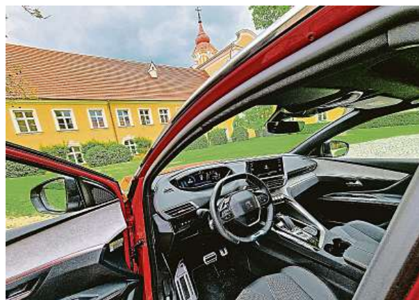
Unikátní uspořádání interiéru nazývá automobilka i-Cockpit a je na něj hrdá. Doporučujeme ho před koupí vyzkoušet.