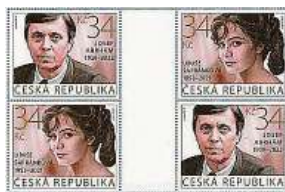
Adresátovi udělají radost.