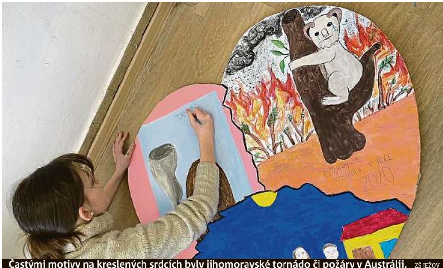
Častými motivy na kreslených srdcích byly jihomoravské tornádo či požáry v Austrálii. ZŠ JEŽOV

„Děti v nedávné době čelily pro ně neobvyklým životním situacím, ať už v podobě pandemie koronaviru, ničivého tornáda na jihu Moravy, nebo války na Ukrajině. Samy se staly ohroženou skupinou,