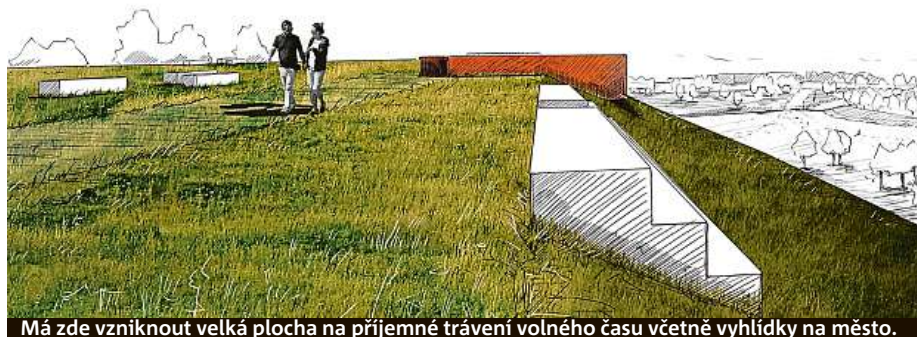
Má zde vzniknout velká plocha na příjemné trávení volného času včetně vyhlídky na město.