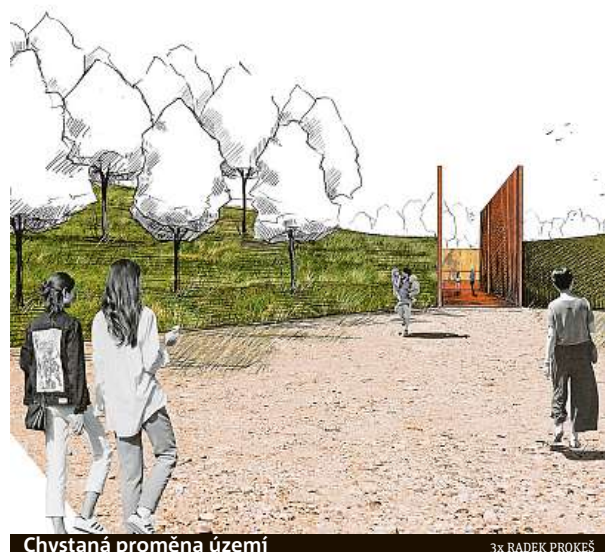
Chystaná proměna území