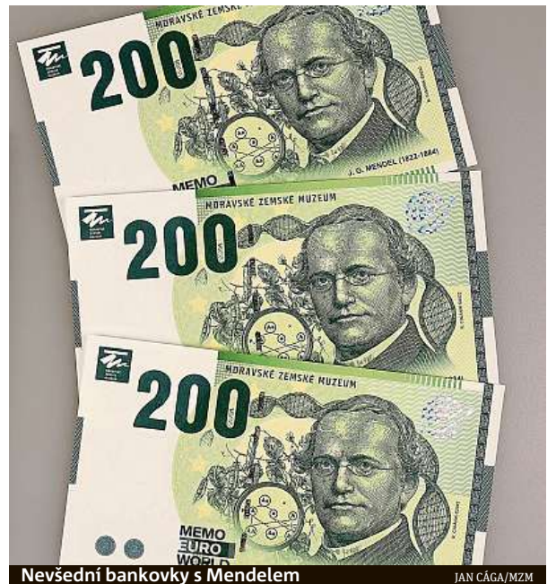
Nevšední bankovky s Mendelem

Expozice, ve které se každý může stát vědcem, představují osobnost a dílo Mendela a také souvislosti s dnešní genetikou, molekulární biologií a dalšími obory. Jedinečné jsou také několikametrové modely DNA a genové exprese doplněné 3D animacemi, které umožňují návštěvníkům doslova aktivní vstup do buňky. RADEK BABIČKA