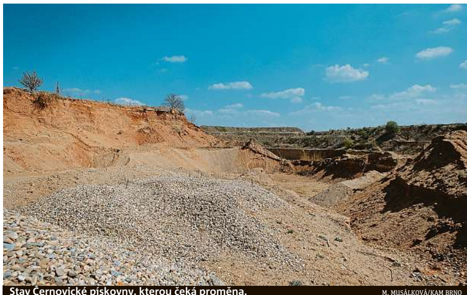
Stav Černovické pískovny, kterou čeká proměna.