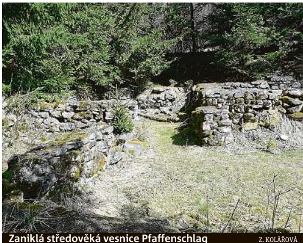
Zaniklá středověká vesnice Pfaffenschlag

Kdo vládl na stolové hoře Vladařovi v době železné, co se asi tak odehrálo v tajemné Býčí skále nebo jak vypadají nejstarší jeskynní malby v Česku? Na tyto otázky odpoví archeologové přímo v terénu.