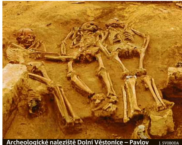
Archeologické naleziště Dolní Věstonice – Pavlov