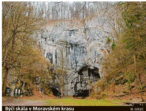
Býčí skála v Moravském krasu

Prohlídky na akci Archeologické léto 2021 zajistí zkušební archeologové, kteří zájemcům představí, co vše obnáší práce archeologa. Veškeré informace včetně seznamu lokalit najdete na portálu www.archeologickeleto.cz . MET