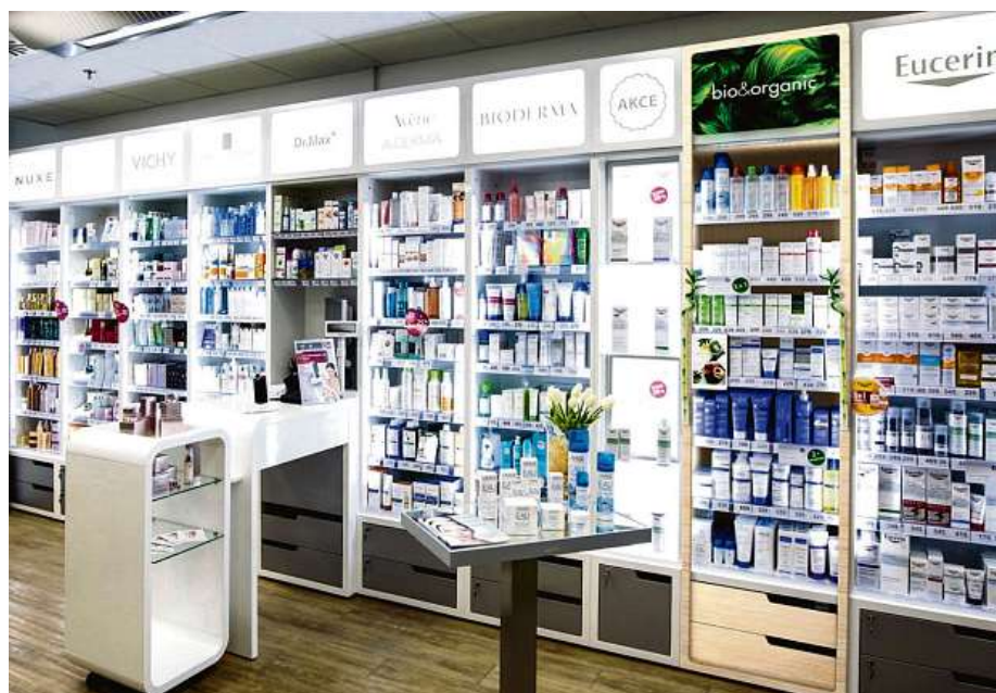
V poslední době se nabídka dermoproduktů v lékárnách Dr.Max rozrostla i o speciální sekci přírodních produktů „Bio & Organic“