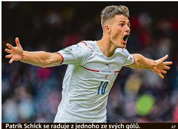
Patrik Schick se raduje z jednoho ze svých gólů.

V závěru mohl Schick dovršit hattrick, ale Marshalla ne-