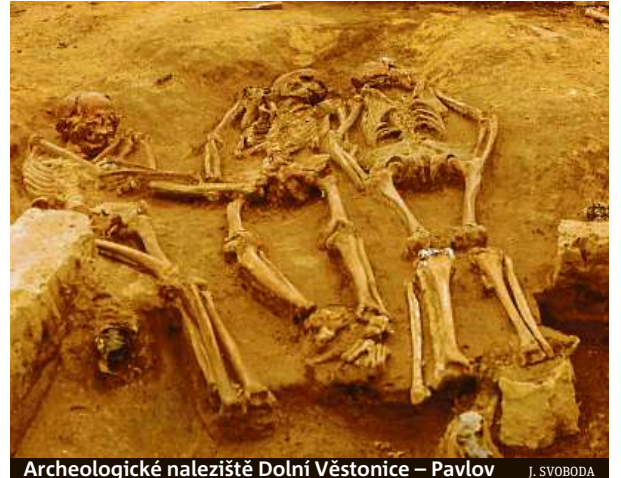
Archeologické naleziště Dolní Věstonice – Pavlov