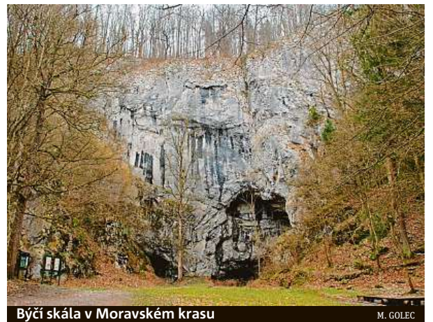
Býčí skála v Moravském krasu

Prohlídky na akci Archeologické léto 2021 zajistí zkušební archeologové, kteří zájemcům představí, co vše obnáší práce archeologa. Veškeré informace včetně seznamu lokalit najdete na portálu www.archeologickeleto.cz . MET