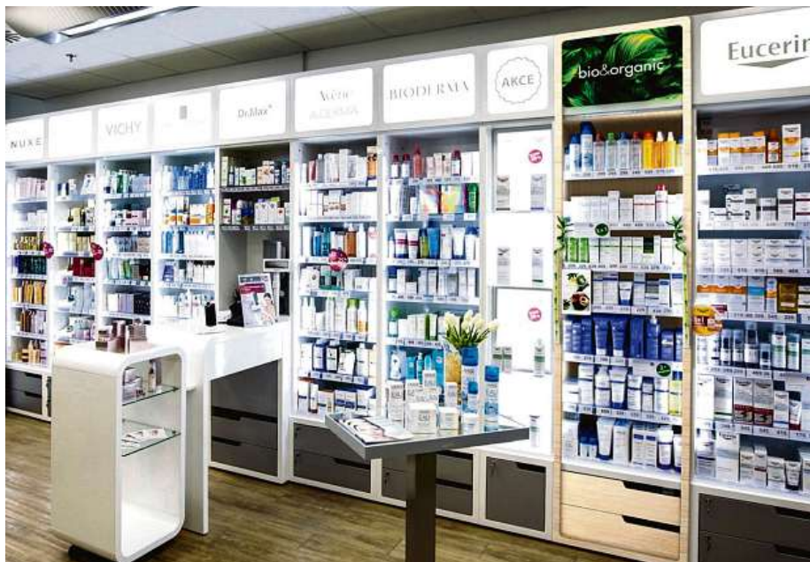
V poslední době se nabídka dermoproduktů v lékárnách Dr.Max rozrostla i o speciální sekci přírodních produktů „Bio & Organic“