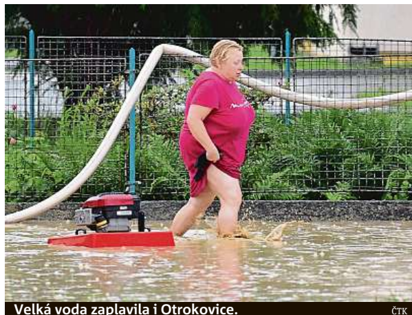
Velká voda zaplavila i Otrokovice.