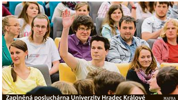
Zaplňená posluchárna Univerzity Hradec Králové

Většina českých vysokých škol si letos polepšila v mezinárodním žebříčku, který každoročně zveřejňuje britská společnost Quacquarelli Symonds (QS). Nejvýše se z českých zástupců, stejně jako v minulých letech, umístila Univerzita Karlova, která poskočila z loňského 291. místa na 260. V první pětistovce jsou ještě pražské Vysoká škola chemicko-technologická (VŠCHT) a České vysoké učení technické (ČVUT). VŠCHT je na 342. místě, loni byla 355. ČVUT si polepšilo dokonce o 66 míst a obsadilo v letošním roce v celkovém hodnocení 1604 univerzit 432. příčku.