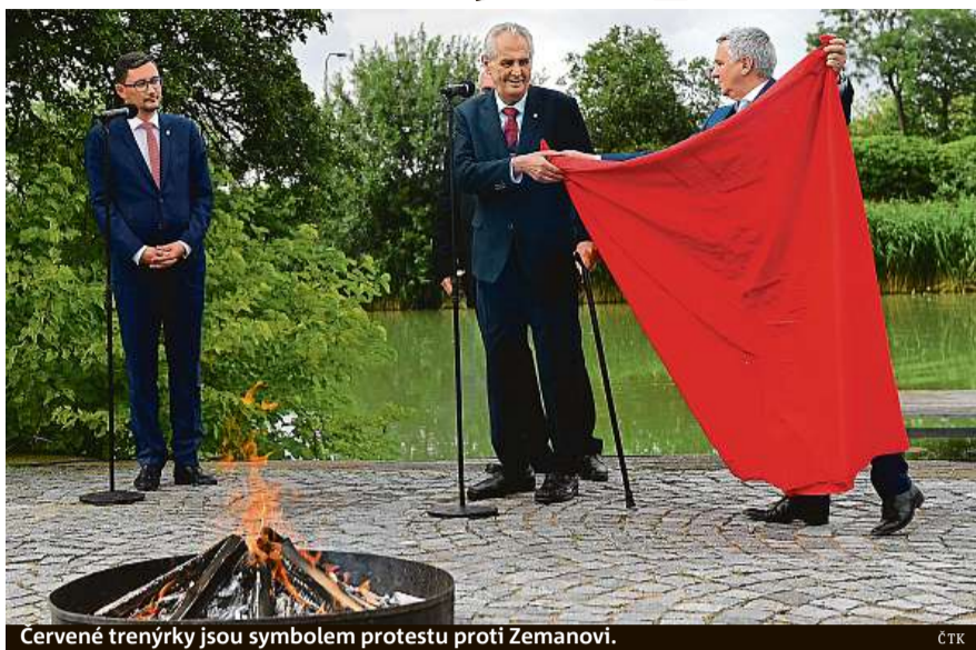
Červené trenky jsou symbolem protestu proti Zemanovi.