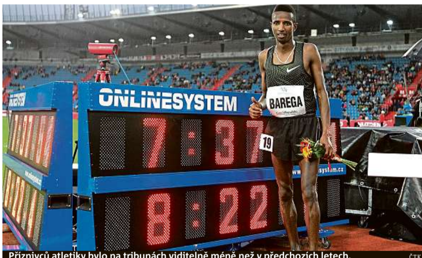
Průběžně atletiky bylo na tribunách viditelně méně než v předchozích letech.

Pořadatelé atletického mítinku si myslí, že příčinou nižší návštěvnosti je počasí i neúcast Bolta.