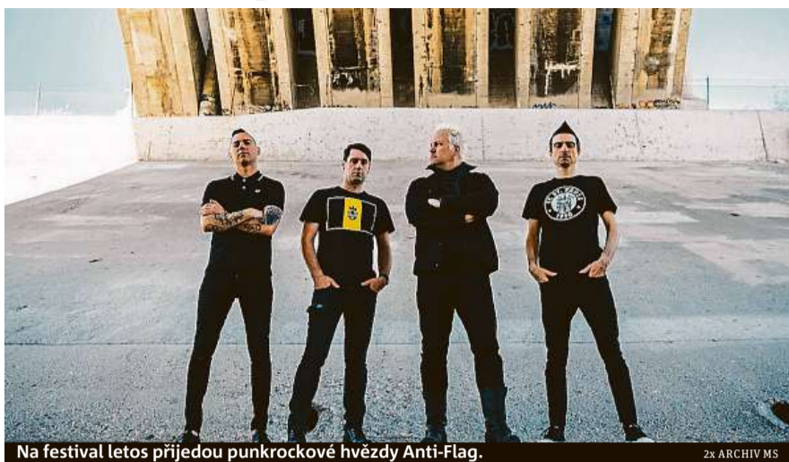
Na festival letos přijedou punkrockové hvězdy Anti-Flag.

Velká jména se vrací i do hudební části programu, která sází na humor. Po čtyřech letech dorazí na Mighty multimilionář a trendsetter Kapi-