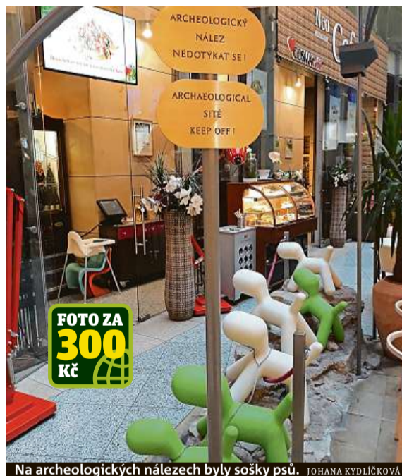
Na archeologických nálezech byly sošky psů. JOHANA KYDLÍČKOVÁ

Je tomu jedenáct let, co se na náměstí Republiky poprvé otevřelo nákupní centrum Palladium. Jeho vedení, které čelilo kritice kvůli komerční zástavbě v historickém centru, se tehdy dušovalo, že pro ně budou svaté alespoň architektonické nálezy. Archeologové tady totiž při stavbě objevili zbytky románského paláce a nechali je rozmístěné ve spodním patře budovy. Kameny staré několik století jsou zde od té doby vybaveny cedulí „Nedotýkat se!“ a ostře kontrastují s moderním vybavením centra. Jak ale zdokumentovala čtenářka Jo-