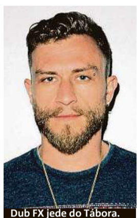
Dub FX jede do Tábora.