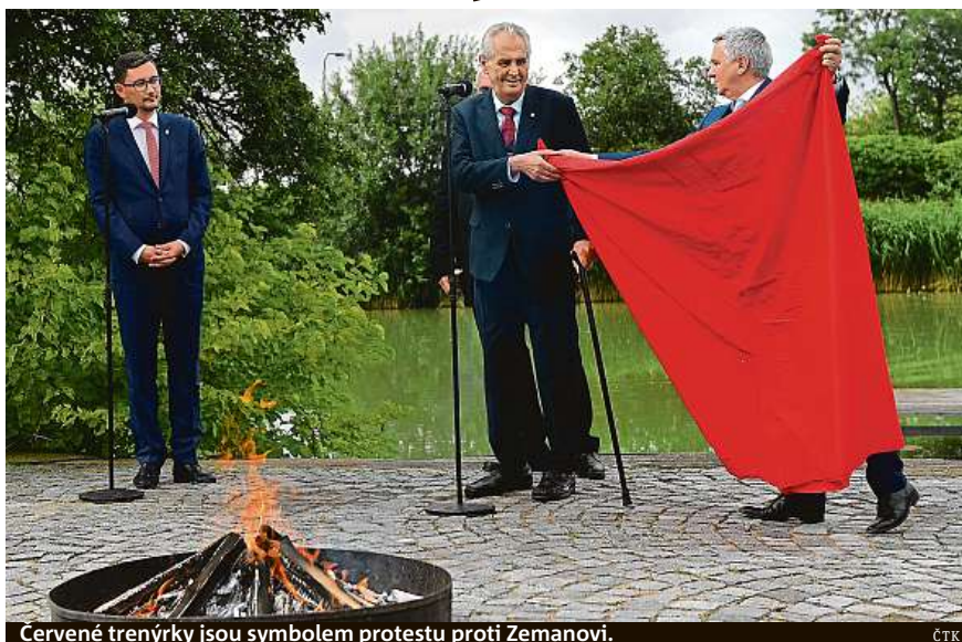
Červené trenky jsou symbolem protestu proti Zemanovi.