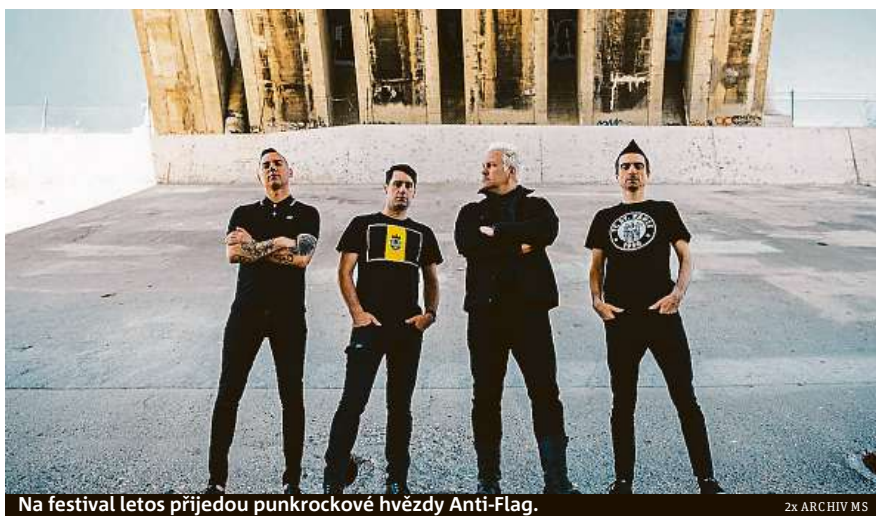
Na festival letos přijdou punkrockové hvězdy Anti-Flag.

Do Tábora totiž letos přijdou punkrockové hvězdy Anti-Flag i severští králové garage rock'n'rollu Royal Republic. „Folk punk nejvyšší kvality dovezou The Rumjacks a dokonalou reggae show předvedou legendární Inner Circle,“ říká mluvčí festivalu Markéta Stechová. Tím výčet top žánrových jmen nekončí, na programu jsou třeba i Talco, Dub FX, Booze & Glory, The