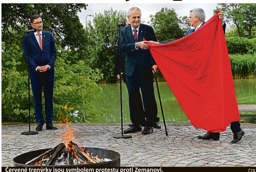
Červené trenky jsou symbolem protestu proti Zemanovi.