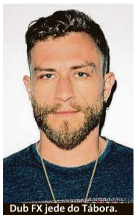
Dub FX jede do Tábora.

I letos je festival nabitý také další produkcí v podobě DJ setů, výběru toho nejlepšího z alternativního divadla, tradičních i netradičních sportovních aktivit a dalšího doprovodného programu.