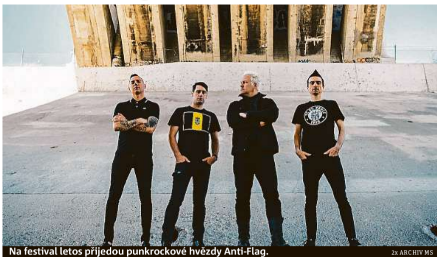
Na festival letos přijdou punkrockové hvězdy Anti-Flag.