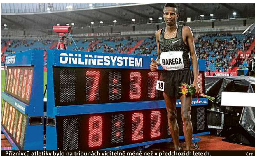
Příznivců atletiky bylo na tribunách viditelně méně než v předchozích letech.

Pořadatelé atletického mítinku si myslí, že příčinou nižší návštěvnosti je počasí i neúcast Bolta.