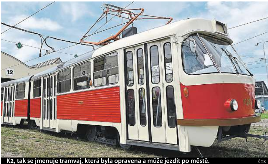
K2, tak se jmenuje tramvaj, která byla opravena a může jezdit po městě.

Oprava „ká dvojky“ je pokračováním nové snahy dopravního podniku vlastnit a provozovat muzejní vozidla. Zatímco Technické muzeum v Brně udržuje spíše starší typy, dopravní podnik se soustředí na ty, které ještě před pár lety jezdily, či dokonce stále jezdí. Vedle typů T3 a K2 se chystá renovace tramvaje T2 do stavu ze 70. let. „Ta by měla být hotová snad příští rok na jaře,“ poznamenal Jiří Černý, který má projekt rekonstrukcí historických vozidel na starosti. Sběrka se má brzy rozrůst