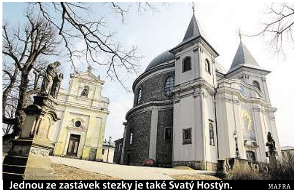
Jednou ze zastávek stezky je také Svatý Hostyn.

Jihomoravský kraj se přidá ke Zlínskému a čtyřem slovenským, které chtějí spojit turistické cíle v jednu poutní stezku, svatých Cyrila a Metoděje.