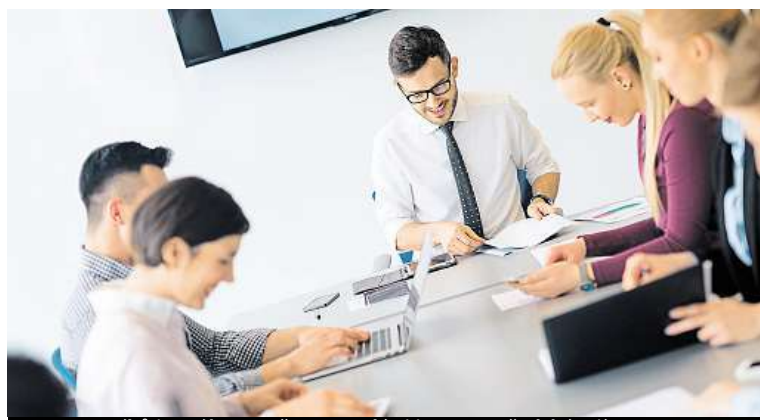
IT pracovníků je málo, zaměstnavatelé si je proto předchází.

V Jihomoravském kraji v prvním čtvrtletí stoupla meziročně průměrná hrubá mzda o 5,9 procenta na 25 857 korun, lidem přibýlo 1449 Kč. Po započítání inflace byl růst 5,4 procenta. Mzdy rostly ve všech krajích, jedinou výjimkou byla Praha. Vyplývá to z informací, které zveřejnil Český statistický úřad. Podle analytika společnosti Cyrrus Jiřího Šimary jsou aktuální čísla výsledkem razantního poklesu nezaměstnanosti a začínajícího boje zaměstnavatelů o kvalitní pracovníky.