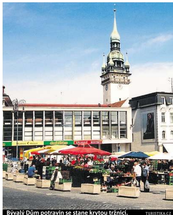
Bývalý Dům potravin se stane krytou tržnicí.

Myšlenkou projektu je uchopit budovu tržnice jako celek a představit ji coby nedílnou součást náměstí, které se zrekonstruovalo v posledních letech. „Chceme cíleně propojit všechna patra budovy a okolních prostor tak, aby návštěvník mohl využívat služeb všech zúčastněných subjektů v různých pat-