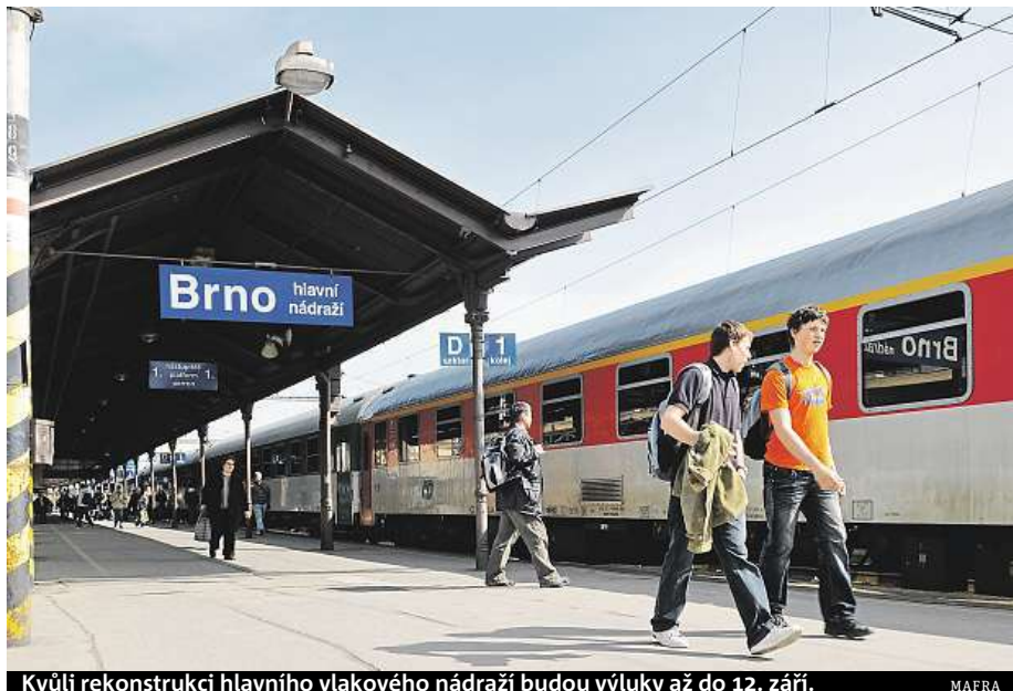
Kvůli rekonstrukci hlavního vlakového nádraží budou výluky až do 12. září.

Od 7. července do 3. srpna se tak interval mezi vlaky sníží z tradiční prázdninové půlhodiny na patnáct minut. Všem cestujícím doporučují vlaky využít,“ říká náměstek