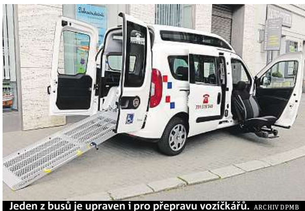
Jeden z busů je upraven i pro přepravu vozíčkářů.

„Jednou jízdou se rozumí přejezd od nástupu do výstupu a zpět, pokud čekání nepřekročí patnáct minut. Pokud vůz na klienta čeká déle než čtvrt hodinu, musí senior zaplatit dalších padesát korun,“ vysvětluje provozní ředitel dopravního podniku Jiří Valníček. Veškeré další náklady, které mají ročně přesahovat čtyři miliony korun, bude dotovat brněnský magistrát. Senior BUS jezdí každý den