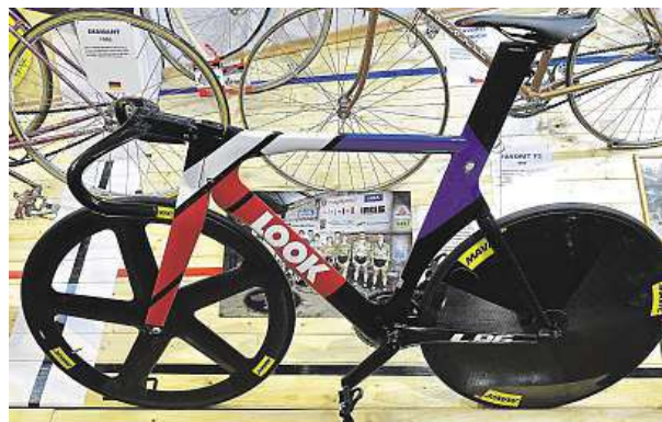
Dráhový sprinterský speciál mistra Evropy Pavla Kelemena

půjčil také stroj francouzské výroby Look za téměř 350 tisíc korun. „Jde o speciál, se kterým loni vybojoval Pavel Kelemen titul mistra Evropy v keirin na dráze,“ poznamenal Nakládal. čtk