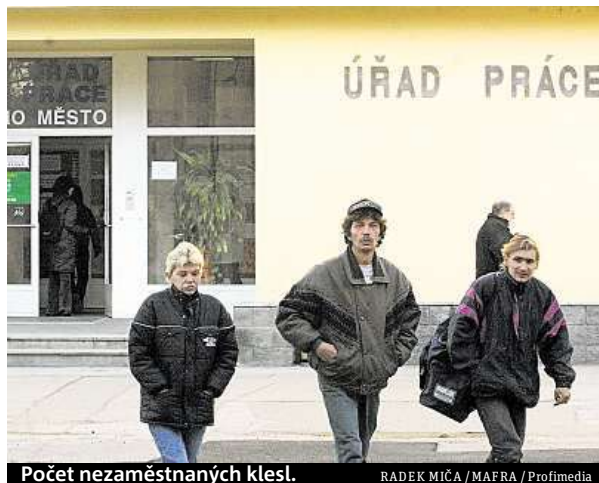
Číslo nezaměstnaných klesá.

Jihomoravská metropole ale nabízí v kraji nejvíc volných míst, nyní je jich přes