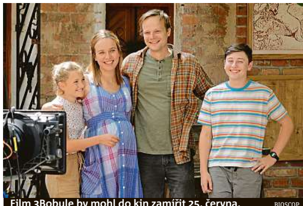
Film 3Bobule by mohl do kin zamířit 25. června. BIOSCOP

Když se v polovině března uzavřely tradiční kinosály, české podnikavé hlavy okamžitě začaly oprašovat americkou klasiku – autokina. K jejich zbudování stačí jen nějaký nevyužívaný prostor jako louka, brownfield či vnitroblok, projektor a vysílač signálu skrze autorádio ve voze. Pandemie koronaviru tak možná do budoucna pomohla autokinům začlenit se i do tuzemského mainstreamu. A to přesto, že si jejich první