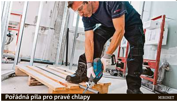
Pořádná pila pro pravé chlapy

Ideálním nástrojem pro precizní motorové řezání dřeva je aku pila ocaska BOSCH GSA 18V-LI C. Díky kompaktním rozměrům s ní obratně zvládnete nařezat vše, co