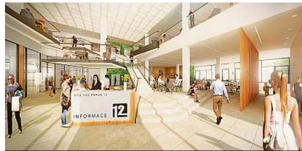
Vizualizace vstupní haly radnice NOXIA