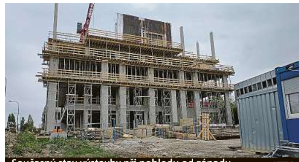
Současný stav výstavby při pohledu od západu METRO