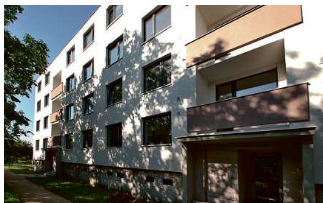
Investiční byty v zrekonstruovaném domě v Brně-Chrlicích.

Investiční skupina e-Finance, a.s. nabízí k prodeji pět bytů 4+1 a dva byty 3+1. Byty jsou po rekonstrukci a nacházejí se v atraktivní lokalitě v Brně-Chrlicích v kompletně zrekonstruovaném domě. V současnosti jsou byty pronajaté na dobu určitou jednoho roku seriózním nájemcům. Nájem s nájemcem se může každý rok prodloužit nebo ukončit. Roční výnos z nájmu po odečtu plateb ve prospěch společenství vlastníků bytových jednotek činí 3,7%.