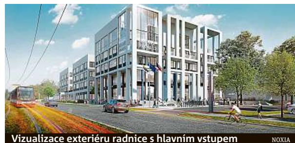
Vizualizace exteriéru radnice s hlavním vstupem NOXIA

Zatím ještě není rozhodnuto, ale je to jedna z budov, které mohou být nabídnuty k pronájmu nebo postoupeny magistrátu pro další činnosti. Chtěli jsme se dohodnout, aby se do této budovy přesunul například také finanční úřad, ale k dohodě zatím nedošlo. JOSEF ŠKVR