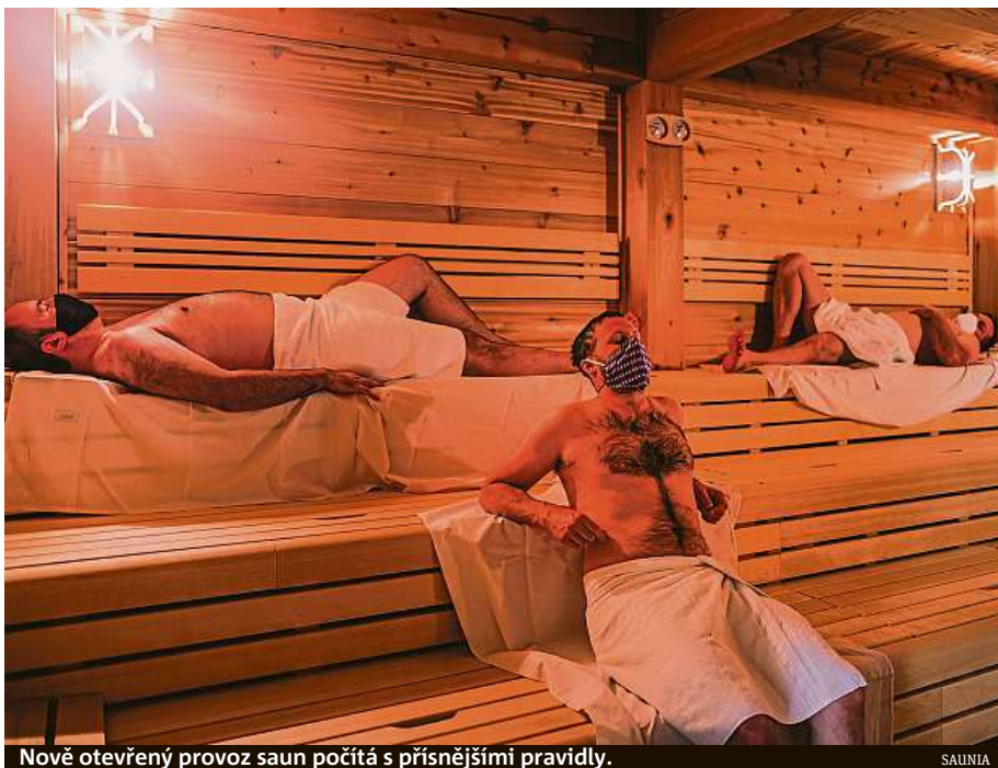
Nově otevřený provoz saun počítá s přísnějšími pravidly.

KOUPÍM PAROŽI, TROFEJE I CELÉ SBÍRKY. Tel.: 773 191 811 trofejeeu@gmail.com