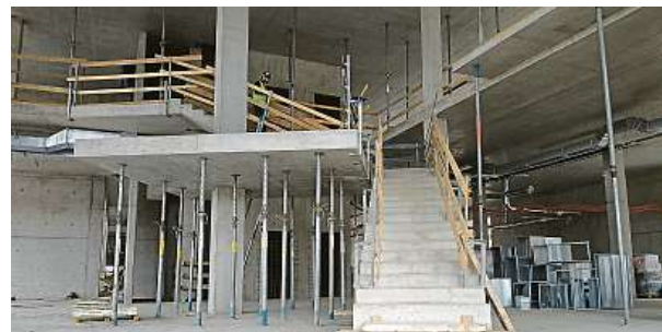
Současný stav vstupní haly METRO

Kancelář řádkové inzerce: Václavské náměstí 1, palác koruna, Praha 1