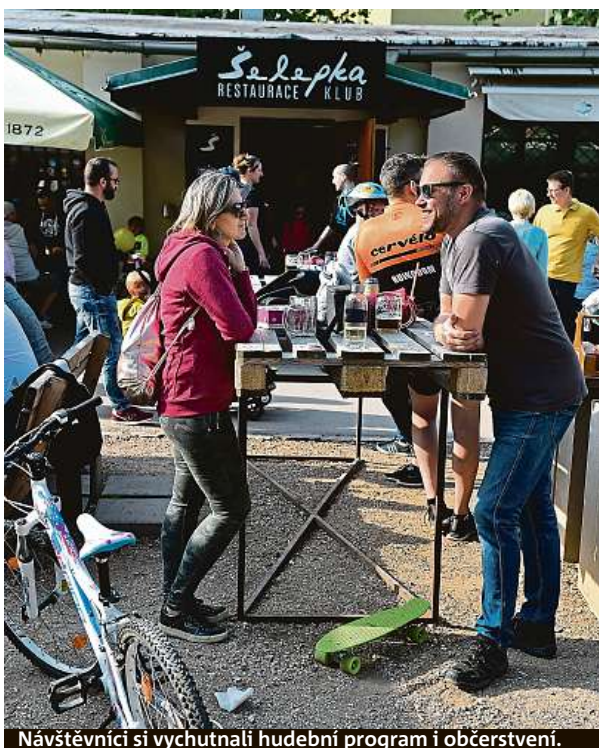
Návštěvníci si vychutnali hudební program i občerstvení.