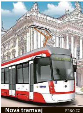
Nová tramvaj BRNO.CZ

Tramvají bude 41 a jde o středně kapacitní vozy zhruba pro 150 lidí. Dopravní podnik zaplatí za komponenty a projektovou dokumentaci 1,3 miliardy korun. Jde o typ vozů EVO, jež už v Česku v některých městech jezdí. Na výrobě se podílí Alian-