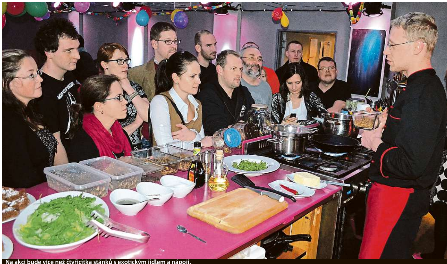
Na akci bude více než čtyřicet stánků s exotickým jídlem a nápoji.

Food festival se tentokrát koná na fotbalovém stadionu. Akci okoření chození po střechách či pivní jóga.