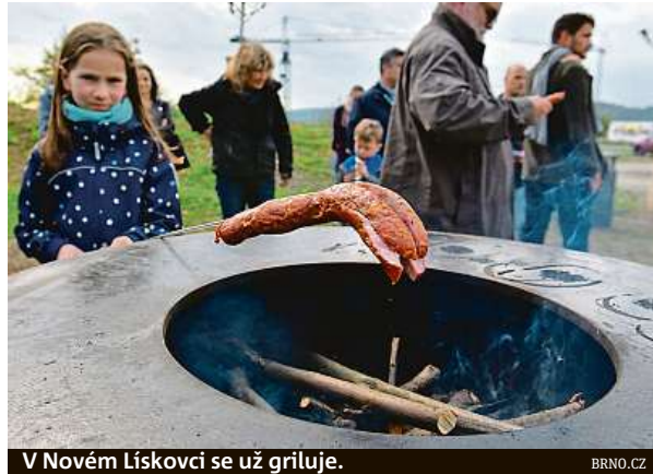
V Novém Lískovci se už griluje.

Již nyní je vidět, že občané takové místo budou hojně využívat a další zanedbaný kout tak získá smysluplné využití,“ komentovala nový kout pro trávení volného