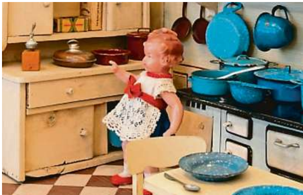
Expozice v Letohrádku Mitrovských

V Česku jde o ojedinělou kolekci, která vyniká nejen stářím a autenticitou, ale i množstvím detailních doplňků, jimiž jsou domečky a salonky pro panenky zaříze-