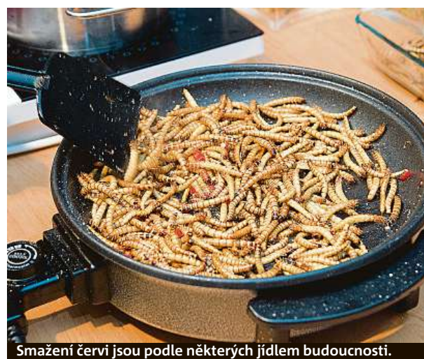
Smažení červi jsou podle některých jídel budoucnosti.

Doprovodný program čtvrtého ročníku festivalu Extrem food nabízí díky většímu prostoru mnoho novinek. Mezi nimi například