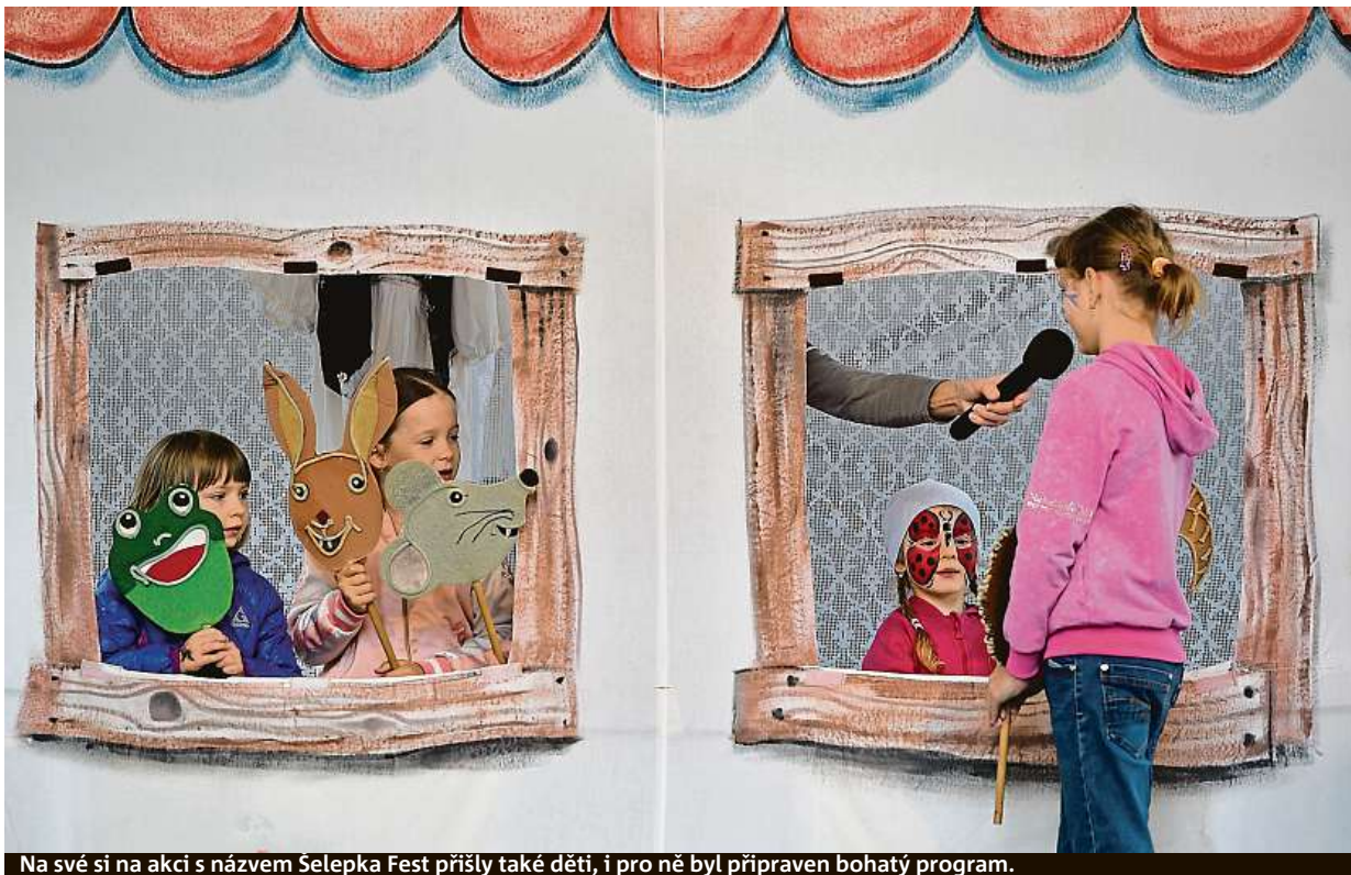
Na své si na akci s názvem Šelepka Fest přišly také děti, i pro ně byl připraven bohatý program.