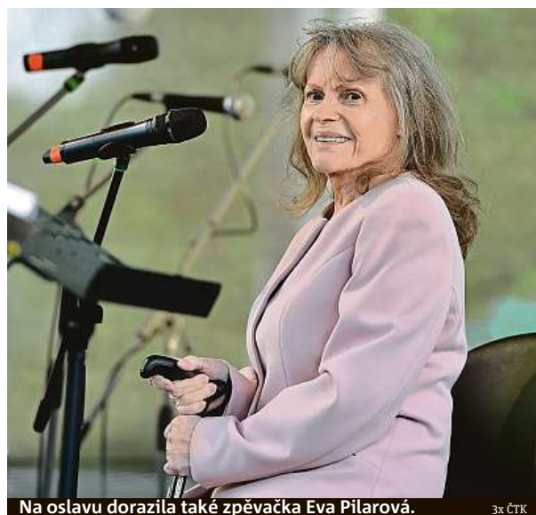
Na oslavu dorazila také zpěvačka Eva Pilarová.