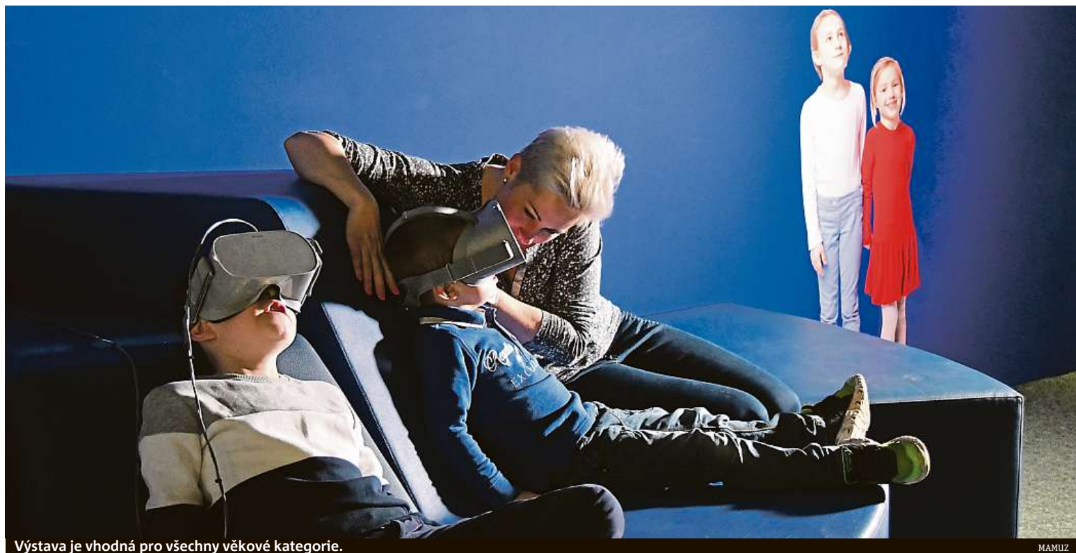
Výstava je vhodná pro všechny věkové kategorie.