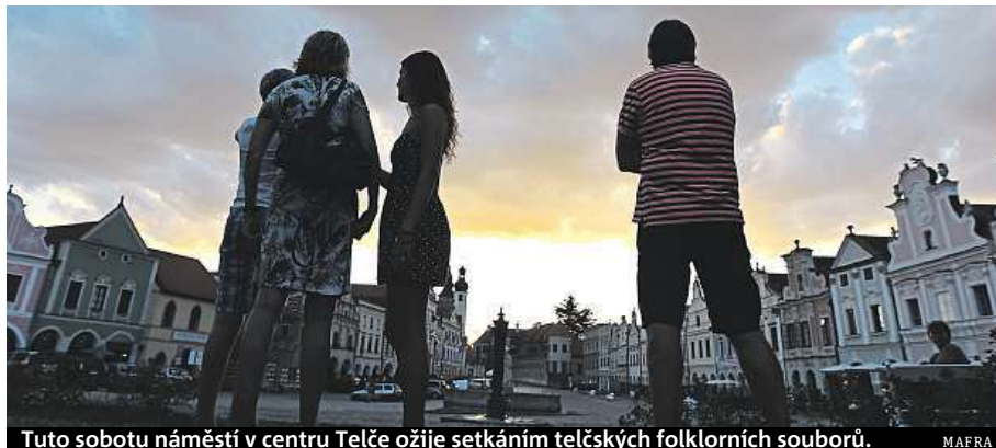
Tuto sobotu náměstí v centru Telče ožije setkáním telčských folklorních souborů.

V květnu už je o víkendech otevřeno. V tomto období před hlavní sezónou je však třeba předem navštívit informační centrum, které s vámi vyšle brigádníka, ideálně po jedenácté nebo čtrnácté hodině. Přímě na protilehlé části