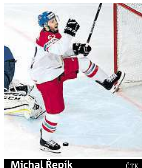
Michal Řepík ČTK

Po jednom z vyloučení naskočil rovnou z trestné lavice