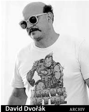
David Dvořák ARCHIV

Změnil obecný pohled na to, že dětem stačí málo, protože nemají schopnost kvalita-