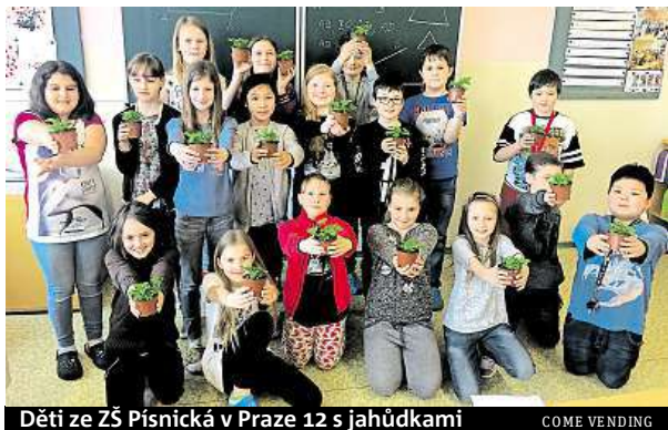
Děti ze ZŠ Písnická v Praze 12 s jahůdkami

Zástupci programu Adoptuj si svou jahůdku rozdali sazeniček přes 40 tisíc. „Cílem projektu je vyvinout kladný vztah dětí k ovoci a zelenině. Každé dostane i pracovní list, kde je popsán návod, jak o rostlinku pečovat. Součástí listu je občanský průkaz jahůdky, kam si dítě vyplní, jak se jahůdky jmenuje a komu patří,“ vysvětluje Markéta Kubecová z Come vending.