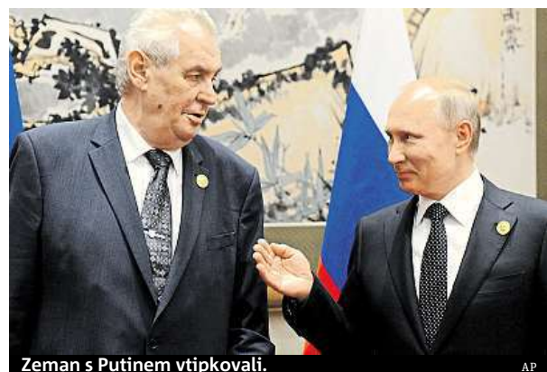
Zeman s Putinem vtipkovali.