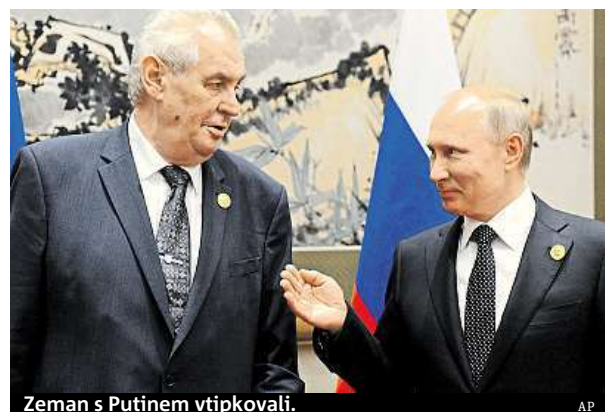
Zeman s Putinem vtipkovali.