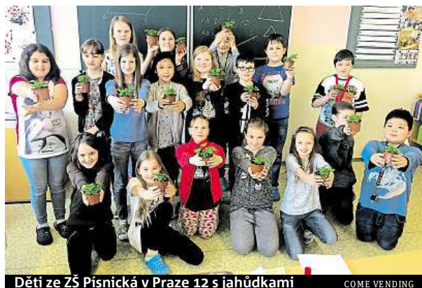
Děti ze ZŠ Pisnická v Praze 12 s jahůdkami

Lepší povědomost o zdravé stravě mají děti také díky mobilní aplikaci Kozel Ovozel. Žáci ve hře plní úkoly a odpovídají na otázky. Aplikaci spustil Státní zemědělský intervenční fond ke konci loňského roku a stala se velmi populární. Obě akce jsou součástí projektu Ovoce a zeleni-