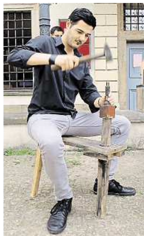
Ražení kladivem METRO

brusných past i rytí reliéfů medailí pod mikroskopem jsme si na vlastní kůži vyzkoušeli na workshupu pořádaném při příležitosti Dne České mincovny.