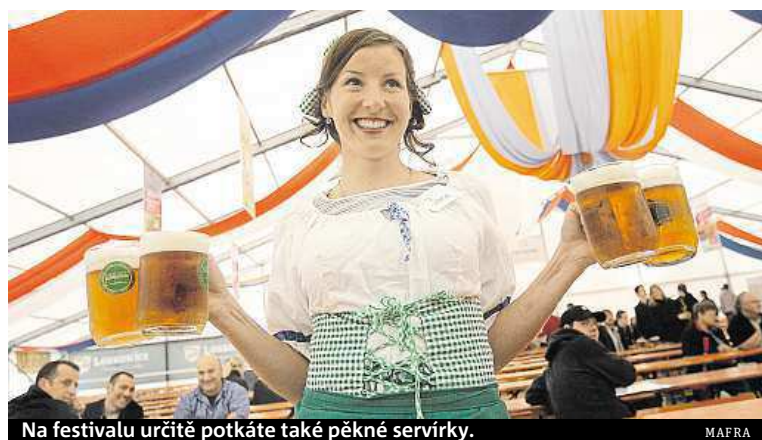
Na festivalu určitě potkáte také pěkné servírky.