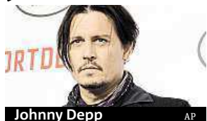
Johnny Depp

Dva psi amerického herce Johnnyho Deppa, kteří s ním v jeho soukromém letounu přiletěli v dubnu na natáčení do Austrálie, se musejí vrátit do USA. Jinak jim hrozí utracení. Zvířata prý totiž na australské území podle tamních