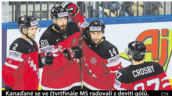
Kanadáné se ve čtvrtfinále MS radovali z devíti gólů.