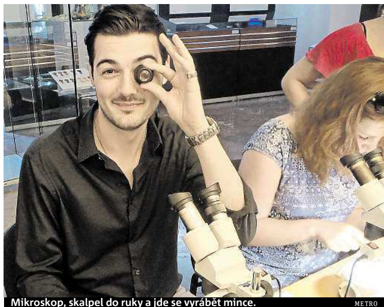
Mikroskop, skalpel do ruky a jde se vyrábět mince. METRO