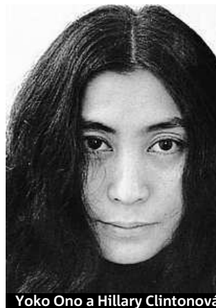
Yoko Ono a Hillary Clintonová v 70. letech

Vdova po Johnu Lennonovi šokovala přiznáním, že v sedmdesátých letech měla milostný poměr s Hillary Clintonovou.