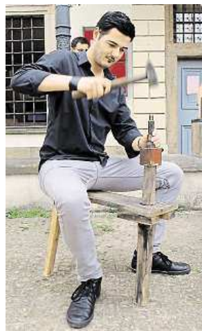
Ražení kladivem METRO

brusných past i rytí reliéfů medailí pod mikroskopem jsme si na vlastní kůži vyzkoušeli na workshupu pořádaném při příležitosti Dne České mincovny.