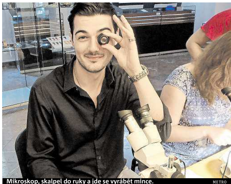
Mikroskop, skalpel do ruky a jde se vyrábět mince.