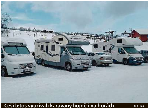
Češi letos využívali karavany hojně i na horách. MAERA

Jak by cimrmanovský inspektor Trachta z klasického filmu Rozpuštěný a vypuštěný jistě správně prohlásil, tak jako nefunkční mastička na růst vlasů od továrníka Bierhanzla dělá z mužů plešatce, tak virus devastuje hotelnictví, ale bezesporu vhná zákazníky do náručí těch, kteří nabízejí domovy na kolečkách.