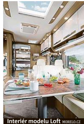
Interiér modelu Loft MORELO.CZ

Co se změnilo v porovnání s minulými roky před pandemií, je rezervace půlročních a ročních vozů ke koupi po konci sezony. „Dodací lhůty na nové jsou v některých případech až dvouleté, takže zajistit si karavan používaný v půjčovně jednu až dvě sezony je pro ně zajímavé,“ dodává Havelka. PAVEL HRABICA