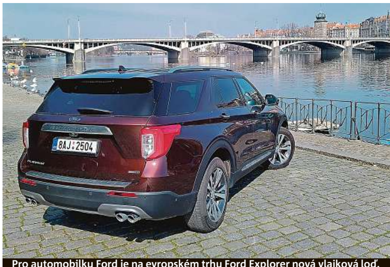
Pro automobilku Ford je na evropském trhu Ford Explorer nová vlajková loď.