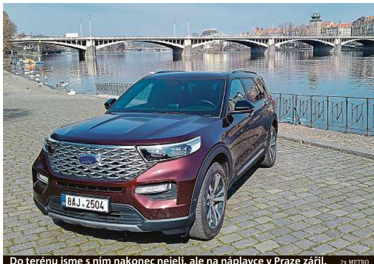
Do terénu jsme s ním nakonec nejeli, ale na náplavce v Praze zářil. 2x METRO