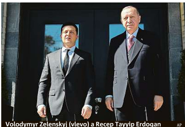
Volodymyr Zelenskyj (vlevo) a Recep Tayyip Erdogan

Moskva odpovědělableskově: ode dneška na sedm týdnů pozastavila lety do Turecka, kam se už chystaly tisíce ruských turistů. Oficiálně kvůli koronaviru, málokdo však pochybuje, že to je trest za jednání se Zelenskyj.