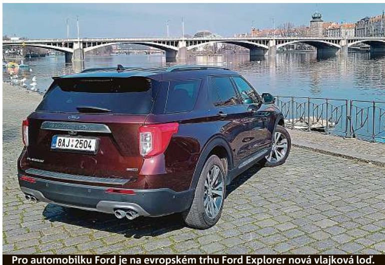
Pro automobilku Ford je na evropském trhu Ford Explorer nová vlajková loď.