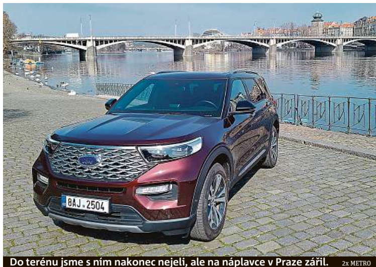
Do terénu jsme s ním nakonec nejeli, ale na náplavce v Praze zářil. 2x METRO