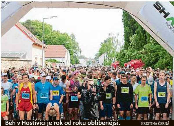
Běh v Hostivici je rok od roku oblíbenější.