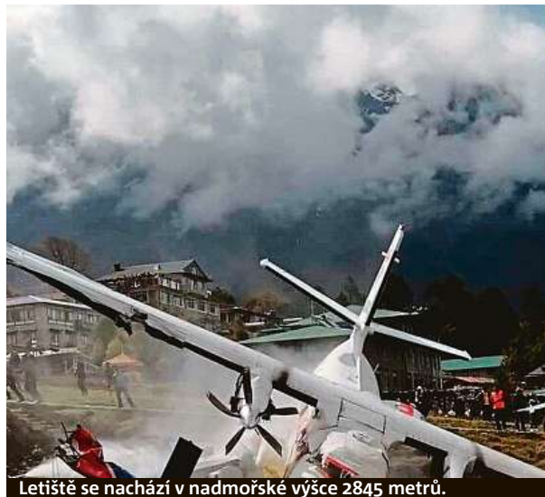
Letiště se nachází v nadmořské výšce 2845 metrů.

Poslední známá žijící samice vzácné želvy kožnatky Swinhoeovy uhynula v zoologické zahradě na jihovýchodě Číny. Oznamily to podle agentury AP místní úřady. Celkem se nyní na světě vyskytují jen tři želvy tohoto druhu. Čínská zoo Su-čou chová jednoho samečka této obrovské sladkovodní želvy. Dvě vzácné kožnatky údajně žijí ještě ve volné přírodě ve Vietnamu, jejich pohlaví však není známo. Podle čínských médií zřejmě poslední samičce na světě bylo 90 let. ČTK