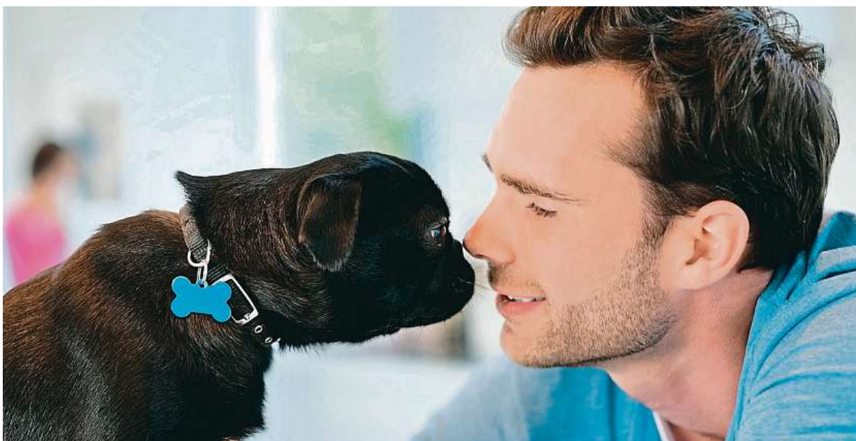
Na sobě ušetříme, miláčka strádat nenecháme.

Díky pokračujícímu polidšování psích mazlíčků lidé začali nakupovat více také výrobky proti klíšťatům, kvalit-