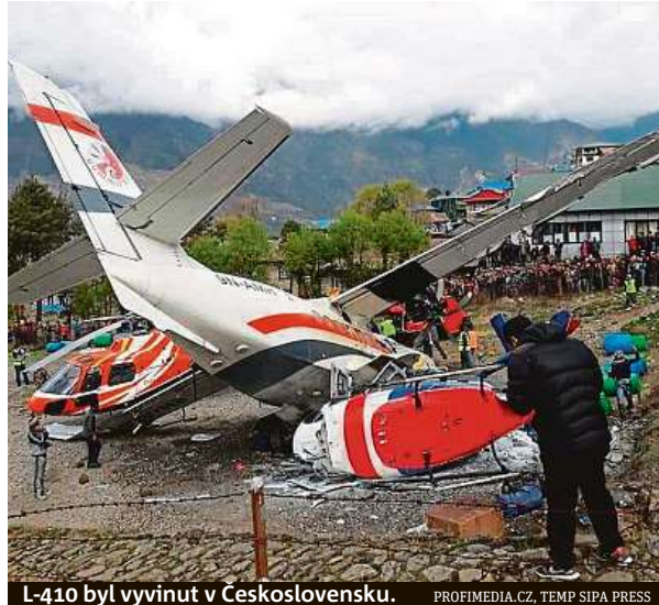
L-410 byl vyvinut v Československu.