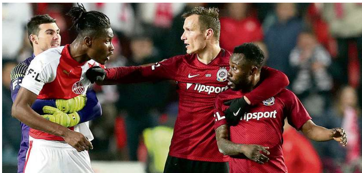
Vyhecované derby bylo plné strkanic. Fotbalisté Slavie remizovali se Spartou 1:1. Více čtete na straně 21.

12 miliard. Tolik lidé ročně utratí za domácí mazlíčky. Rovnou z gauče. Více než v kamenných obchodech Češi nakupují na e-shopech. Veterináři. Nekvalitní levná strava může zvířatům škodit, varují odborníci STRANA 7