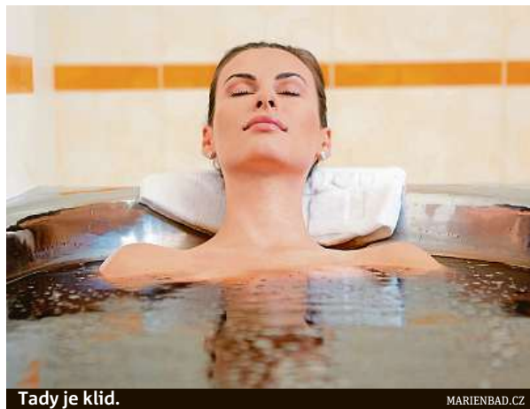
Tady je klid.

Nový bazén skýtá skvělé zázemí pro rehabilitační procedury a jistě bude i příjemným oživením wellness pobytů. Aby se zde návštěvníci cítili co nejlépe, došlo rovněž k proměně interiéru, který získal atraktivní a velmi zajímavý vzhled. Součástí zrekonstruovaného lázeňského centra Palladio je vedle nového bazénu také sauna, parní lázeň a whirlpool společně s relaxačními lehátky. Důležitá investice do z kvalitnější a zkrášlení prostředí hotelo-