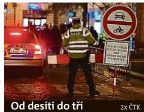
Od desítky do tří

zácpy. „Troubení, randál. Je potřeba to uzavřít až do brzkého rána, jinak to nemá smysl,“ popsal jeden z diskutujících ve facebookové skupině Praha číslo 1.