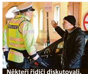
Někteří řidiči diskutovali.

Akce se bude opakovat ještě následující dva víkendy. Cí-