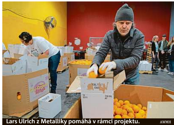
Lars Ulrich z Metalliky pomáhá v rámci projektu.

Letos finanční podpora podporuje projektu Cesta domů, který pomáhá lidem na konci života dožít důstojně a v prostředí jim blízkém. Dále se