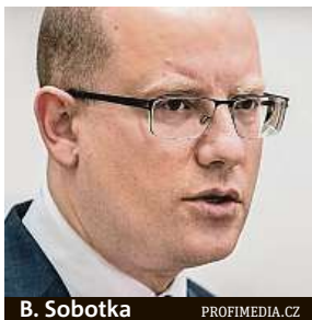
B. Sobotka PROFIMEDIA.CZ

Sněmovnou dosud prošlo přes dva tisíce předpisů. Nejvíce jich protlačil Špidla s Grossem.