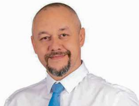
Zdávane! Strana nezavislosti České republiky. Zpracovatel: dcode creatives.co

VYSTUPME Z EU 24. A 25. 5. VOLTE STRANU NEZÁVISLOSTI