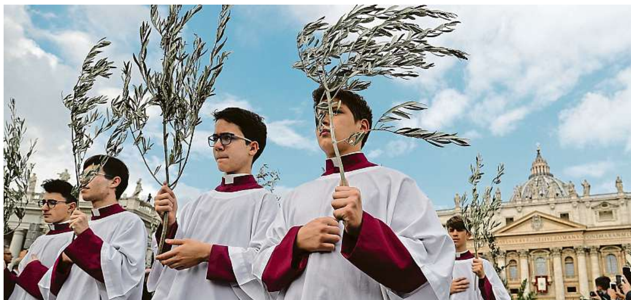
Květnou nedělí začal svatý týden před Velikonocemi. Davy věřících s ratolestmi dorazily na kázání papeže Františka.

12 miliard. Tolik lidé ročně utratí za domácí mazlíčky. Rovnou z gauče. Více než v kamenných obchodech Češi nakupují na e-shopech. Veterináři. Nekvalitní levná strava může zvířatům škodit, varují odborníci STRANA 3