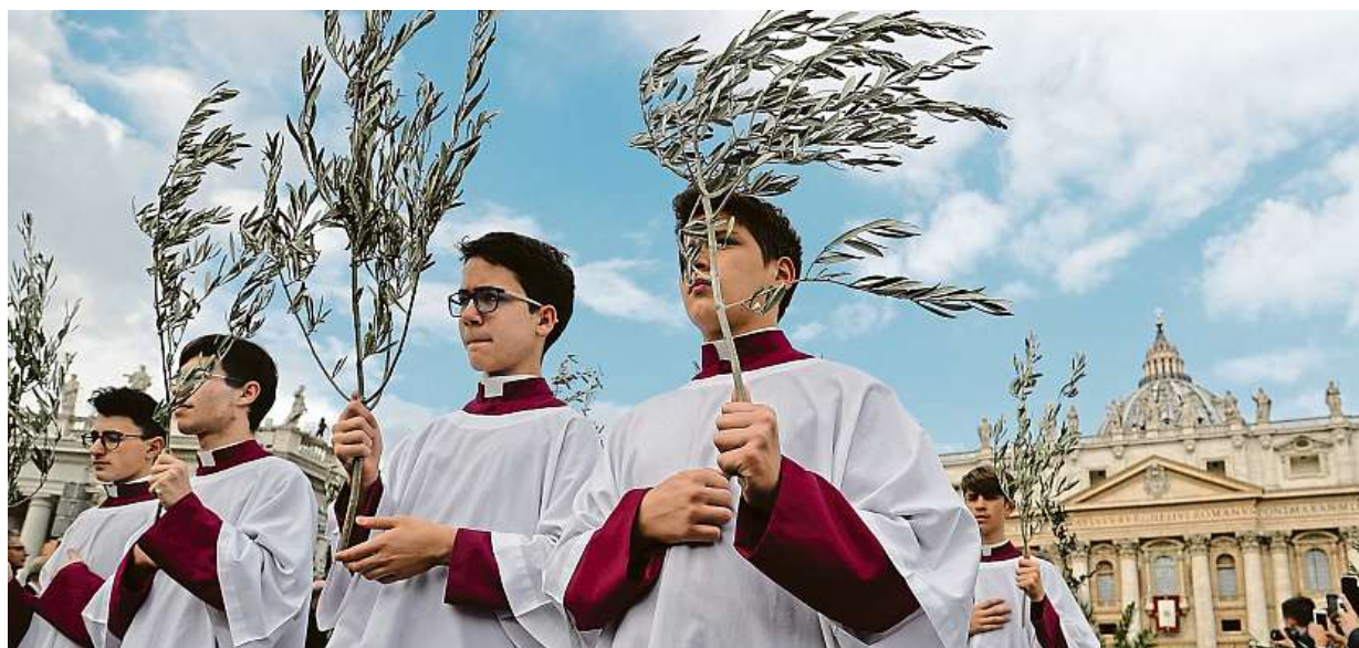
Květnou neděli začal svatý týden před Velikonocemi. Davy věřících s ratolestmi dorazily na kázání papeže Františka.

12 miliard. Tolik lidé ročně utratí za domácí mazlíčky. Rovnou z gauče. Více než v kamenných obchodech Češi nakupují na e-shopech. Veterináři. Nekvalitní levná strava může zvířatům škodit, varují odborníci STRANA 3