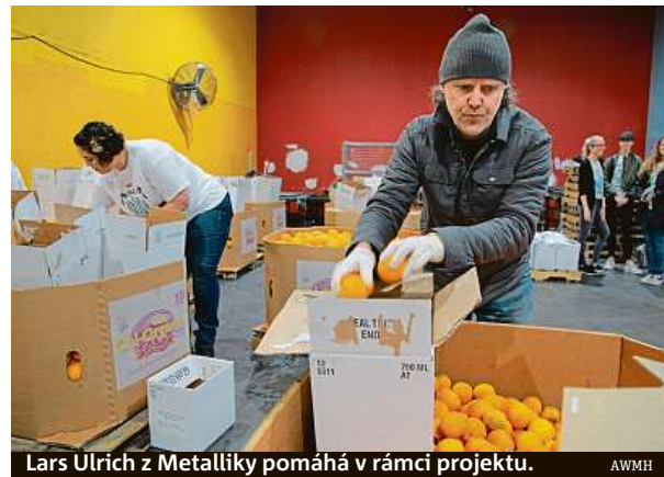
Lars Ulrich z Metalliky pomáhá v rámci projektu.

Letos finanční podpora podporuje projektu Cesta domů, který pomáhá lidem na konci života dožít důstojně a v prostředí jim blízkém. Dále se