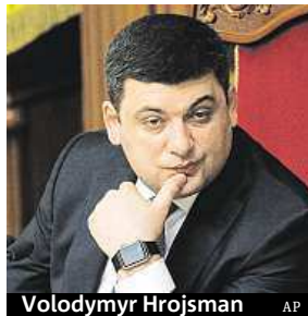
Volodymyr Hrojsman

Novou vládní většinu nyní tvoří jen zástupci dvou nejsilnějších stran – Bloku Petra Porošenka a Jaceňukovy Lidové fronty. Dosavadní vládní koalice se totiž v únoru rozpadla, když podporu kabinetu vypověděly strany Vlast a Svěpomoc. Právě Vlast expremiérku Julije Tymošenkové na zasedání oznámila, že bude v opozici vůči nové Hrojsmanově vládě jako součást „evropské demokratické opozice“. Poro-