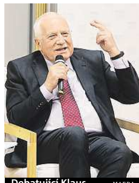
Debatující Klaus

Exprezident zabrousil i na pole evropské politiky. Německo hraje v současné Evropě prim. Němcům se podařilo Evropu ovládnout jinak, než se o to pokoušeli v minulosti. V Česku Klaus vidí slabý článek Visegrádu, když dojde na soudržnost středoevropských států. Naopak nevěří, že by Velká Británie opustila Evropskou unii. IDNES.cz