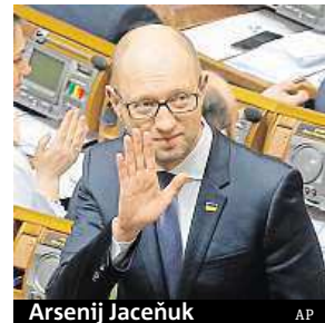
Arsenij Jaceňuk