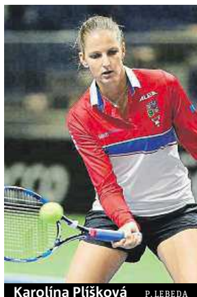
Karolína Plíšková