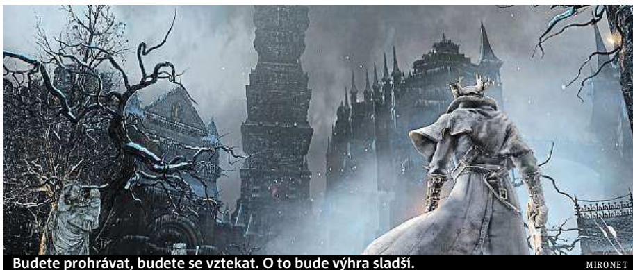
Budete prohrávat, budete se vztekat. O to bude výhra sladší.

I tak je pravdou, že skutečné herní výzvy byste v dnešní