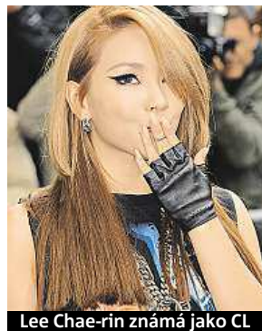
Lee Chae-rin známá jako CL

Podle čtenářů je nejlivnější osobností na světě ruský prezident Vladimír Putin (6,9 procenta čtenářů), v anketě