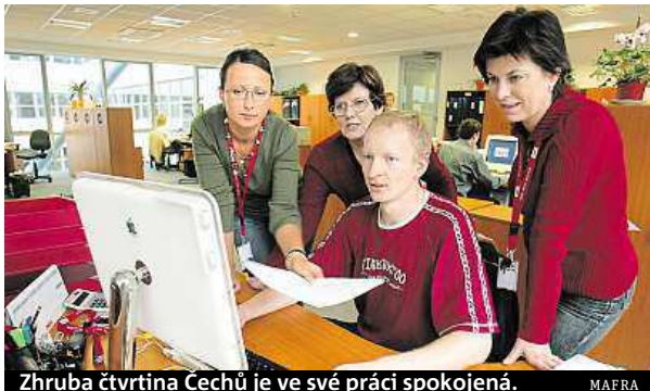
Zhruba čtvrtina Čechů je ve své práci spokojená.