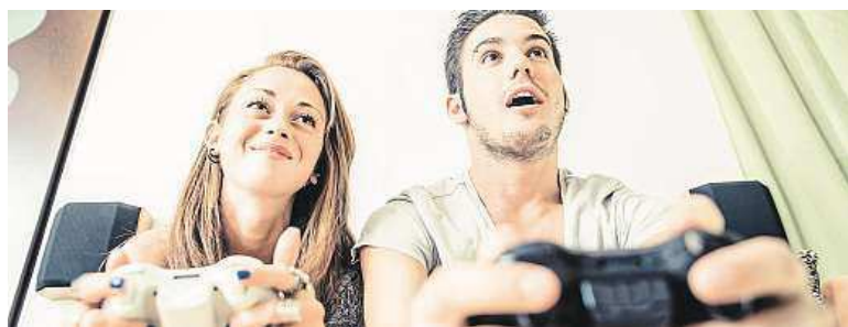
Končit v tom nejlepším už nemusíte.