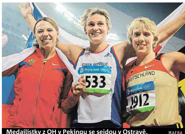
Medailistky z OH v Pekingu se sejdou v Ostravě.

Fanoušci se můžou těšit také na slibovaný souboj hvězdných oštěpařek. Poprvé