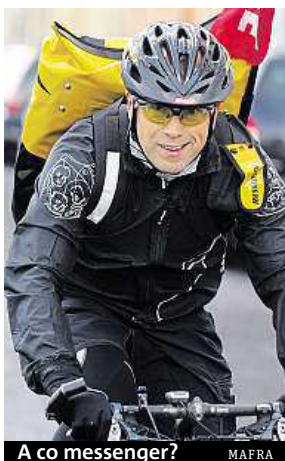
A co messenger? MAFRA

Největší zájem měli loni muži o práci v dopravě, spedici a logistice, ženy nejvíce žádaly pozice v administrativě.