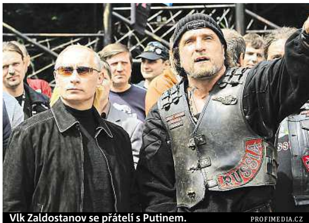
Vlk Zalostanov se přátelí s Putinem.

Jedni vyzývají k družnému přijetí ruských motokářů, což má obnášet asi mávání vlajkami a nějaké občerstvení (tak jako v případě amerických dragounů), podle dru-