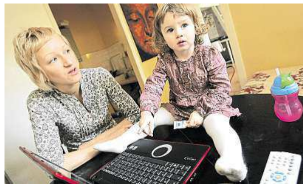
Alternativní úvazky nejsou v Česku příliš využívány.

vat možností alternativních pracovních úvazků a matkám ulehčit sladování rodinného a profesního života,“ řekla ministryně práce a sociálních věcí Michaela Marksová.