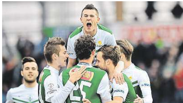
Jablonecká radost v pohárovém utkání se Spartou

Fotbalisté Sparty vypadli ve čtvrtfinále domácího poháru v Jablonci.