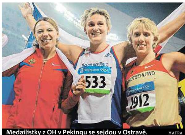
Medailistky z OH v Pekingu se sejdou v Ostravě.

Fanoušci se můžou těšit také na slibovaný soubor hvězdných oštěpařek. Poprvé