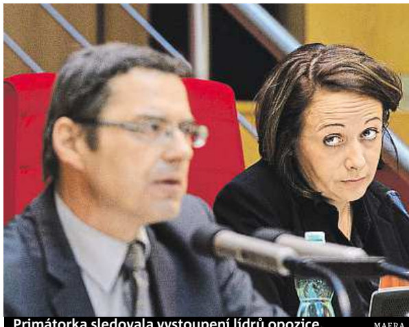
Primátorka sledovala vystoupení lídrů opozice.

Detektivku, kde jste si jméno vraha přečetli hned na začátku, připomínalo včerejší jednání mimořádného zastupitelstva. „Je to zápas, kde dopředu víte, že znáte výsledek.“ ohodnotil včerejší schůzi zastupitel Milan Růžička (TOP 09). I když se opozici podařilo sehnat 27 opozičních hlasů TOP 09, ODS a Pirátů pro zařazení bodu odvolání primátorky na jednání mimořádného zastupitelstva, podařilo se koalici s podporou komunistů nebezpečí odvolání zažehnat už na začátku, hned při jednání o zařazení bodu do programu. Zatímco primátorka a zastupitelé koalice se tvářili, že jim jde jen o to jednání nějak přetrpět, opoziční představitelé naopak předvedli na jednání řadu více či méně uvěřitelných emocí. Opozice totiž měla jedinečnou příležitost dát o sobě vědět a mnohdy se vystoupení netýkala ani primátorky nebo jed-