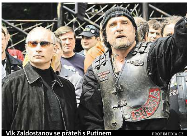
Vlček Zaldostanov se přátelí s Putinem

Jedni vyzývají k družnému přijetí ruských motokářů, což má obnášet asi mávání vlajkami a nějaké občerstvení (tak jako v případě amerických dragounů), podle dru-