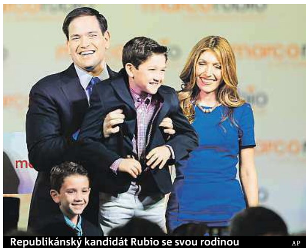
Republikánský kandidát Rubio se svou rodinou

Republikánský senátor za americký stát Florida Marco Rubio oficiálně oznámil, že se ve volbách v roce 2016 chce ucházet o křeslo prezidenta Spojených států.