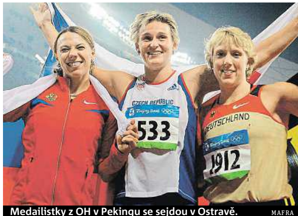
Medailistky z OH v Pekingu se sejdou v Ostravě.

Fanoušci se můžou těšit také na slibovaný soubor hvězdných oštěpařek. Poprvé