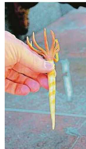
Takhle nějak kdysi vypadala lilijice. Skrývá se i na Smíchově.