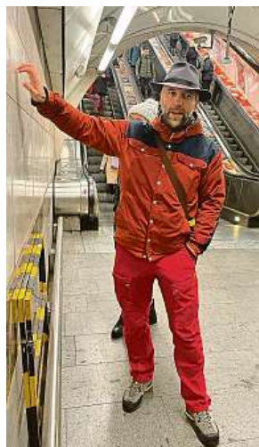
V metru jsme objevili trilobity. Najdete je také? 7x MET a ARCHIV