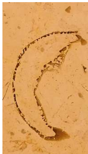
Najdete i vy na Můstku v obkladačkách měsíček?