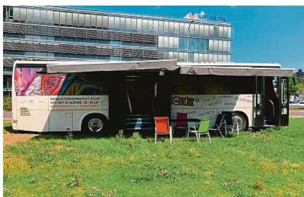
Upravený autobus nesupluje školu ani školní družinu a nezodpovídá za pobyt klientů před ani po ukončení pobytu v klubu.

to často zahánějí nudu experimentováním s návykovými látkami, jako je alkohol, cigarety nebo marihuana. Konzumace alkoholu v pubertě je sice statisticky na ústupu, přesto je stále hojně rozšířená. S tím pomáhají například terénní pracovníci nízkoprahového klubu Autobus z Prahy 14, jenž funguje v rámci neziskové organizace Neposedá. Když není zbytlí, učí mládež i to, jak pít s rozumem. JAR