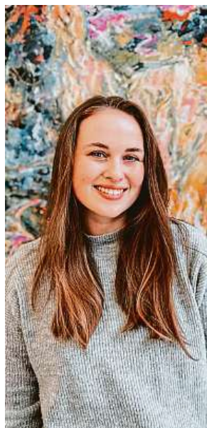
Pracovnice klubu Johy vám zlepši náladu i úsměvem.