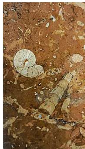
Stočený hlavonožec goniatit a rovný ortoceras na Dejvické

Najdeme i nějaké horniny z Česka, nebo jsou zde jen obklady ze světa?