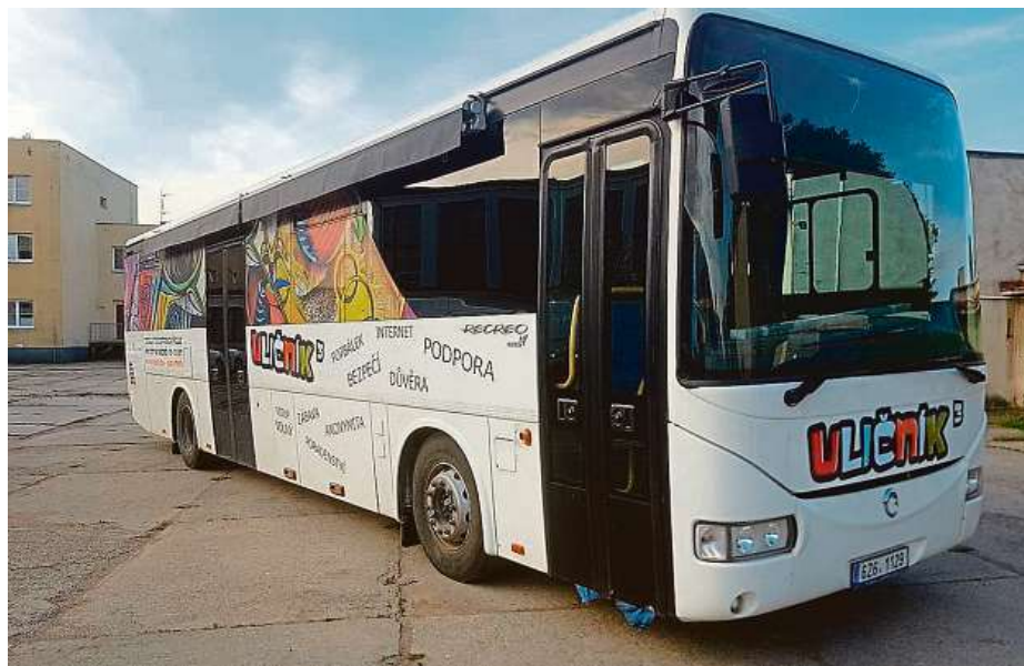
Uličník je unikátní streetworková forma ambulanti služby pro děti a mládež známé jako Klub R-Mosty. Vybavení a služby nízkoprahového klubu platí nejrozličnější donátoři včetně městských částí.