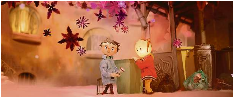
Loutkový film Tonda, Slávka a kouzelné světlo od autora Filipa Pošivače uspěl už na Českých lvech.

Jedna z nejsledovanějších kategorií Anifilmu – mezinárodní soutěž celovečerních filmů – konečně nabyla konkrétní obrysy. V kategorii se udělují dvě ceny (cena pro nejlepší film pro dospělé a cena pro nejlepší film