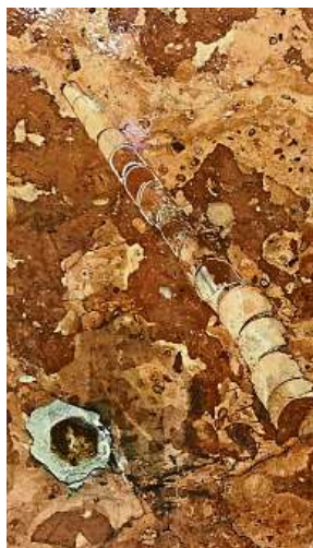
Stanice Dejvická a místní hlavonožec ortoceras

Nikdo před vámi si nevíšl, že jste jediný, kdo podobné vycházky pravidelně pořádá? Jistěže všiml, a dokonce hned několik studentů geologie a František Pekárovič v roce 2008 skvěle popsal a zmápal linku C, která je obložena asi nejzajímavějšími horninami. Jsem ale první paleontolog, který si blíže všiml zkamenělin v obkladech vápenců a jiných hornin a vodí do metra a za tím účelem veřejnost na netradiční geologické vycházky.