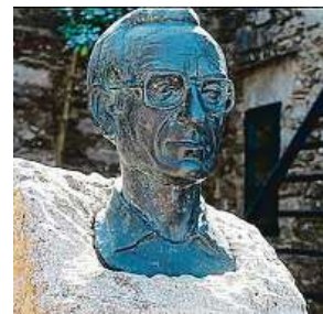
Bustu E. V. Sampedra najdete v obci O Cebreiro.

Statistika nuda je, má však cenné údaje. Myšlenku písnič-