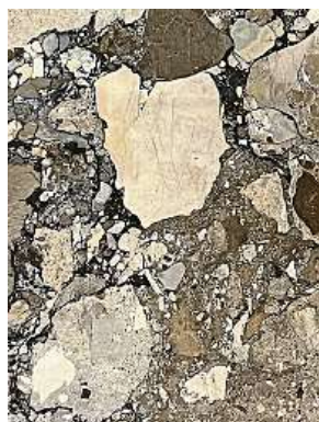
Chcete slyšet geologický vtípek? Tomuhle jevu říkají tlačěnka.

Ano, je to tak. Padesát let je sice úctyhodná doba, ale já se jako paleontolog pohybuji ve stovkách milionů let. Při svých vycházkách pro veřejnost Metro očima geologa, kdy provázím pro Prague Czech Tourism, navštívíme několik stanic všech tří linek a společně poznáváme zkamenělé příběhy v obkladech a pochozích kamenech.