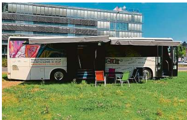
Upravený autobus nesupluje školu ani školní družinu a nezodpovídá za pobyt klientů před ani po ukončení pobytu v klubu.

to často zahánějí nudu experimentováním s návykovými látkami, jako je alkohol, cigarety nebo marihuana. Konzumace alkoholu v pubertě je sice statisticky na ústupu, přesto je stále hojně rozšířená. S tím pomáhají například terénní pracovníci nízkoprahového klubu Autobus z Prahy 14, jenž funguje v rámci neziskové organizace Neposedá. Když není zbytků, učí mládež i to, jak pít s rozumem. JAR