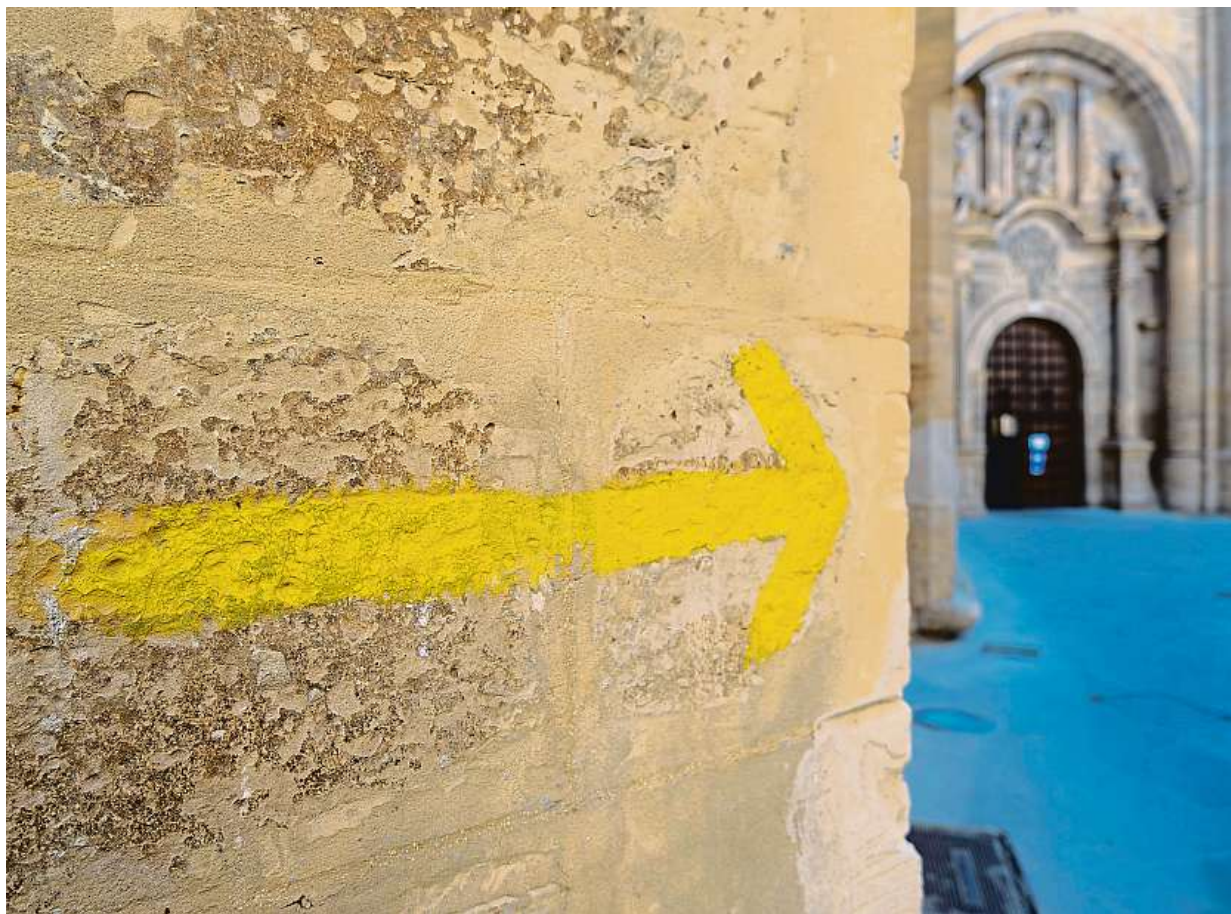
Camino má dvanáct základních tras. Ve Španělsku, Portugalsku, Francii, Německu a Itálii trasy svatojakubské pouti většinou kopírují historické cesty, jsou značeny symbolem mušle a žlutou šipkou.