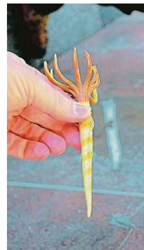
Takhle nějak kdysi vypadala lilijice. Skrývá se i na Smíchově.

Najdeme například průřezy krásných velkých ústřic, tedy mlžů, na Staroměstské či Jiřího z Poděbrad. Jsou medově hnědé barvy a tvoří půlkruhovitě obrysy či spirálně stočené struktury. Ve zbuzanském mramoru na Můstku nahoře v hale nad eskalátory můžeme objevit krásné velké kuželovité schránky prvohorních hlavonožců či nádherně stočené hlavonožce jménem go-