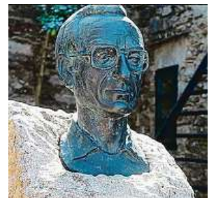
Bustu E. V. Sampedra najdete v obci O Cebreiro. CAMINO WAYS

Statistika nuda je, má však cenné údaje. Myšlenku písnič-