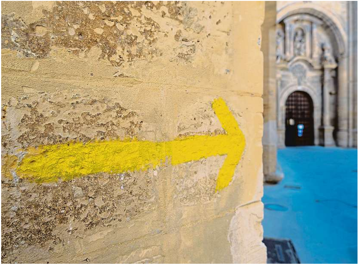
Camino má dvanáct základních tras. Ve Španělsku, Portugalsku, Francii, Německu a Itálii trasy svatojakubské pouti většinou kopírují historické cesty, jsou značeny symbolem mušle a žlutou šipkou.