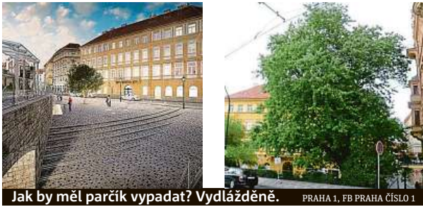
Jak by měl parčík vypadat? Vydlážděně. PRAHA 1, FB PRAHA ČÍSLO 1

Místní se shodují, že je Anenské zákoutí zanedbané a že ho nemohou úplně využít. Na druhou stranu oceňují, že se jedná o zeleň, které v okolí moc není. Zpřístupnění řeky je rozhodně zajímavá věc, která by určitě nalákala mnoho lidí k procházkám, včetně mě. Ale domnívám se, že by podobným projektům neměl ustupovat starý strom. Měli bychom hledat cesty, jak ho zachovat, zpřístupnit řeku a zkulturnit přilehlý parčík.