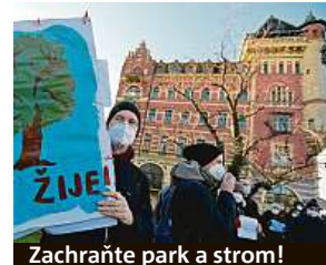
Zachraňte park a strom!