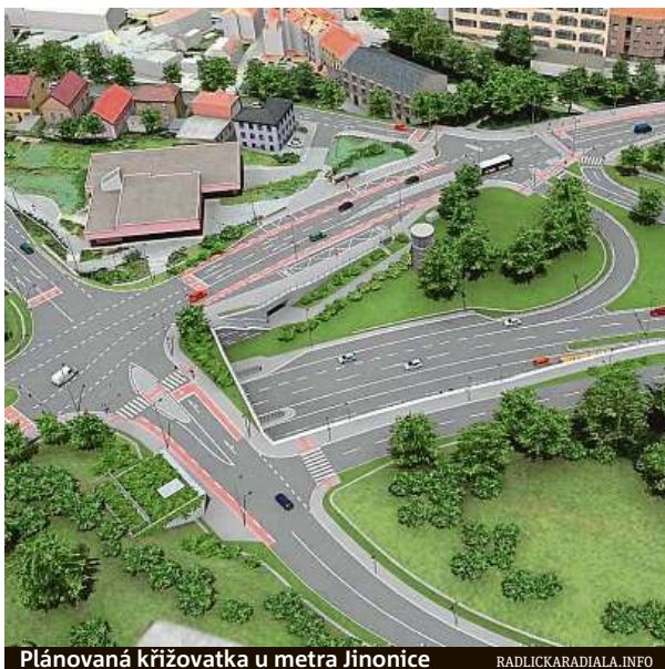
Plánovaná křižovatka u metra Jinoňovice

Kromě stavebního úřadu je pak podle něj problém ve skupince odpůrců stavby z řad místních obyvatel, která drží v šachu všechny dotčené instituce. „Z výzkumu společnosti Sanep z podzimu roku 2017 přitom vyplynulo, že většina obyvatel, kterých se výstavba Radlické radiály dotkne, je nespokojená s aktuální dopravní situací a výstavbu Radlické radiály považuje za důležitou až nezbytnou.