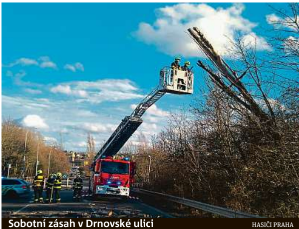
Sobotní zásah v Drnovské ulici