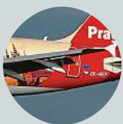
Zbyněk Otáhal Pan Soukup zřejmě potřebuje zvýšit sledovanost.

f Kalousek chystá TV pořad. Co vy na to?